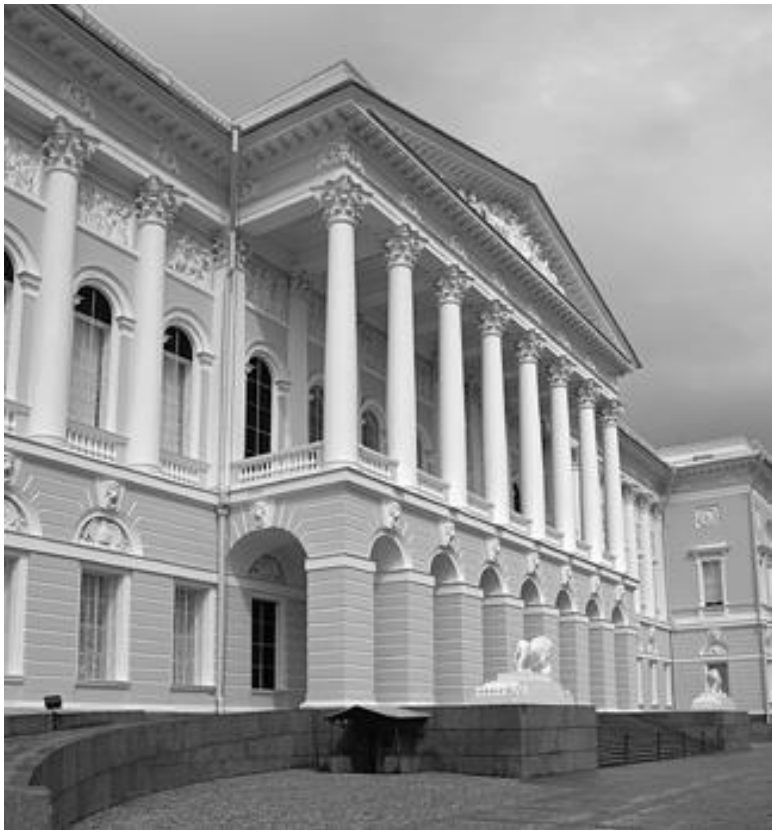
Государственный русский музей, Санкт-Петербург

Насколько можем мы охватить ретроспективу собственной национальной истории – истории государства Российского, – настолько же глубоко в прошлое можем мы загля-