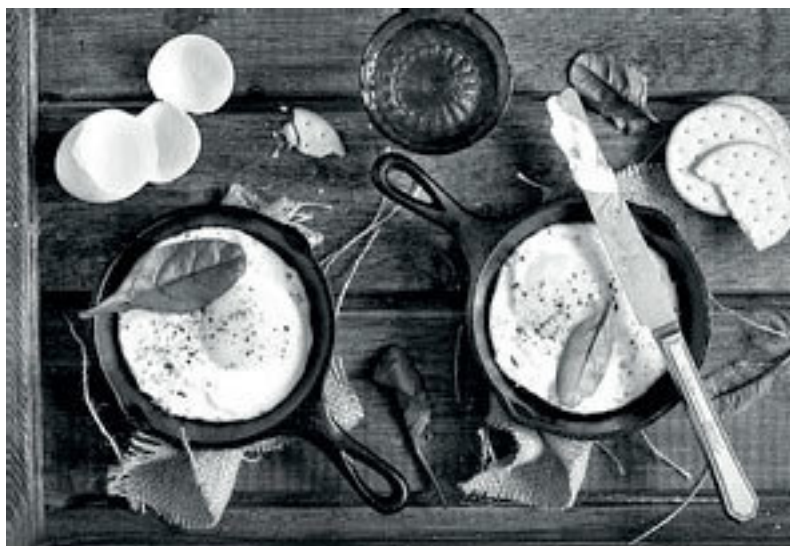
Когда ничего нет или некогда, спасает яичница

У каждого из нас есть своя простая еда, которая нам нужна. Если для русского человека «щи да каша – пища наша», то что же ближе нам?