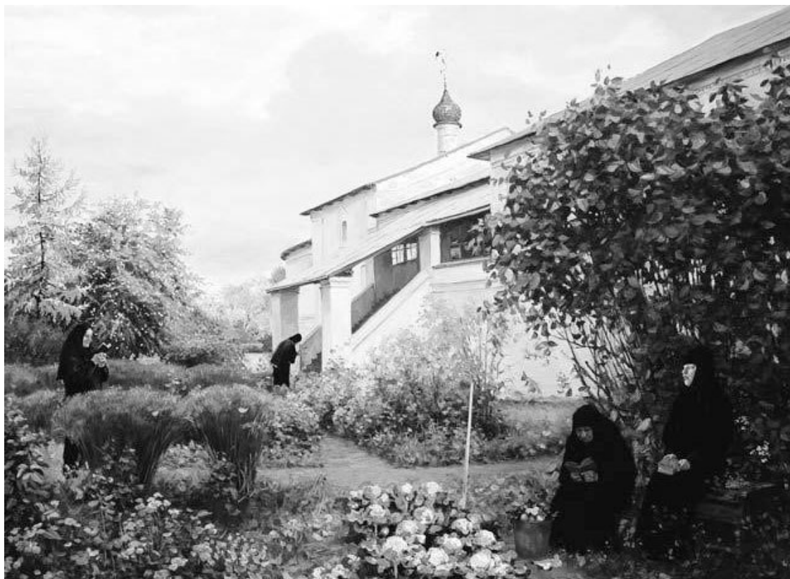
Ю. Сергеев. «В поисках смысла»

Что значит не мешать? Это значит не думать над ним, не сомневаться в нем, не засорять его собственными суетными мыслями и ощущениями. Вот это как раз и трудно, потому что в нашей повседневной мирской жизни мы постоянно все критикуем, осуждаем, суем во все нос, все обдумываем и осмысливаем.