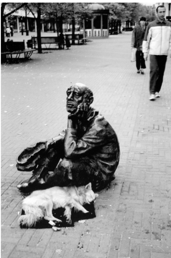
Каштанка и нищий.

Рядом с собачкой обычно была еда – оставляли люди, прохожие и, возможно, работники соседних мест. У собаки появилась подстилка.