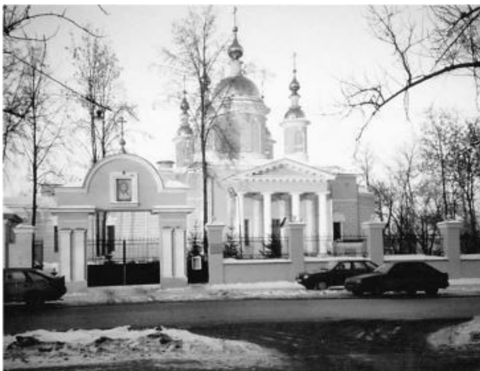
Введенская церковь. Современный вид

ства он слышал слова Евангелия и церковное пение. Когда же Николай немного подрос, он стал читать в церкви Псалтирь и помогать отцу в богослужениях. Все очень любили мальчика и считали, что ребенок отмечен Богом, поэтому часто даже просили у него детских молитв и благословения. Службы в единовечерской церкви – долгие, уставные; утренняя совершается ночью. Мальчик, видя пламенные молитвы отца, был старателен и усерден. Он хорошо, четко и правильно читал, но был так мал, что ему к аналою подставляли скамеечку. Однажды прихожане увидели, как маленький мальчик входит в алтарь через Царские Врата – все усмотрели в этом указание на будущее служение у Престола Божия.