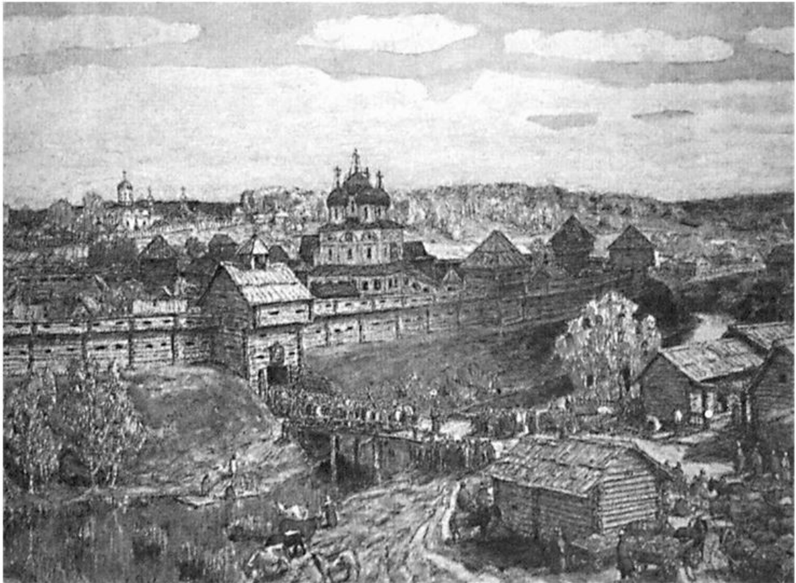
А.М. Васнецов. Древний Дмитров

12/25 января, в день святой мученицы Татианы, Владыка Серафим приехал на место своего архиерейского служения в «Богоспасаемый град Дмитров» (как его тогда называли) 17 . Прибыв в Дмитров, епископ Серафим первым делом отслужил благодарственный молебен. Он был рад, что Господь дал ему возможность послужить на архиерейском поприще в этом чудном уголке древней Руси. А ведь еще в 1915 году батюшка получил Божье указание на свое будущее служение здесь. Возвращаясь с епископом Арсением (Жадановским) из Пешношской обители в Москву, они проезжали Дмитров, и вдруг, напротив Успенского собора, лошади остановились и отказались двигаться дальше. Епископ Арсений и архимандрит Серафим зашли в собор и приложились к главной святыне города – Животворящему Кресту. Владыка Арсений заметил, что это событие не случайно. Он утверждал, что случайностей в жизни не бывает, и говорил: «Над каждым человеком бдит Промысел Божий. Вся жизнь человека находится под непосредственным, хотя и незримым, водительством промышляющей и руководящей Десницы Вышнего».