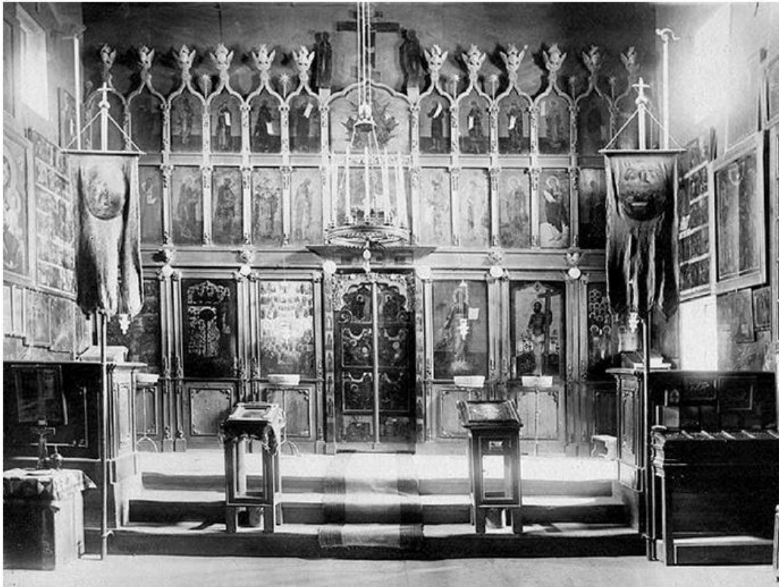
Иконостас Успенской церкви Гефсиманского скита

новопостриженному подходили монахи, спрашивая: «Что ты есть имя, брате?» – в ответ звучало: «Серафим». Это было начало пути.