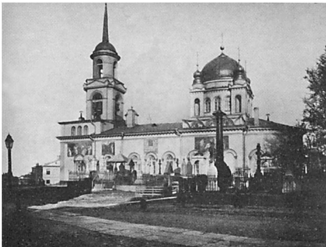
Единоверческая Благовещенская церковь на Волковом кладбище

духовной биографии архиепископа Серафима (Звездинского). Род Бонефатьевых – древний, история его мало изучена; известно лишь, что Иоанн Гаврилович Бонефатьев, будущий отец Владыки, в XIX веке пешком отправился в Петербург из Солигалича и, прибыв в столицу, подал прошение на Высочайшее имя о причислении к Православной Церкви, и, соединившись с ней в Единоверии, был наречен новой фамилией – Звездинский 1 (см. примечания на стр. 61 – ред. ). Иоанн Гаврилович Звездинский получил место чтеца в Благовещенском храме на петербургском Волковском единоверческом кладбище 2 . У него были редкие музыкальные способности и прекрасный голос. В этом храме Иоанн Звездинский познакомился с дочерью священника Василия Славского – Евдокией – и вскоре женился на ней. Приняв священство, отец Иоанн получил назначение во Ржев, а в начале 80-х годов вместе с семьей переехал в Москву.