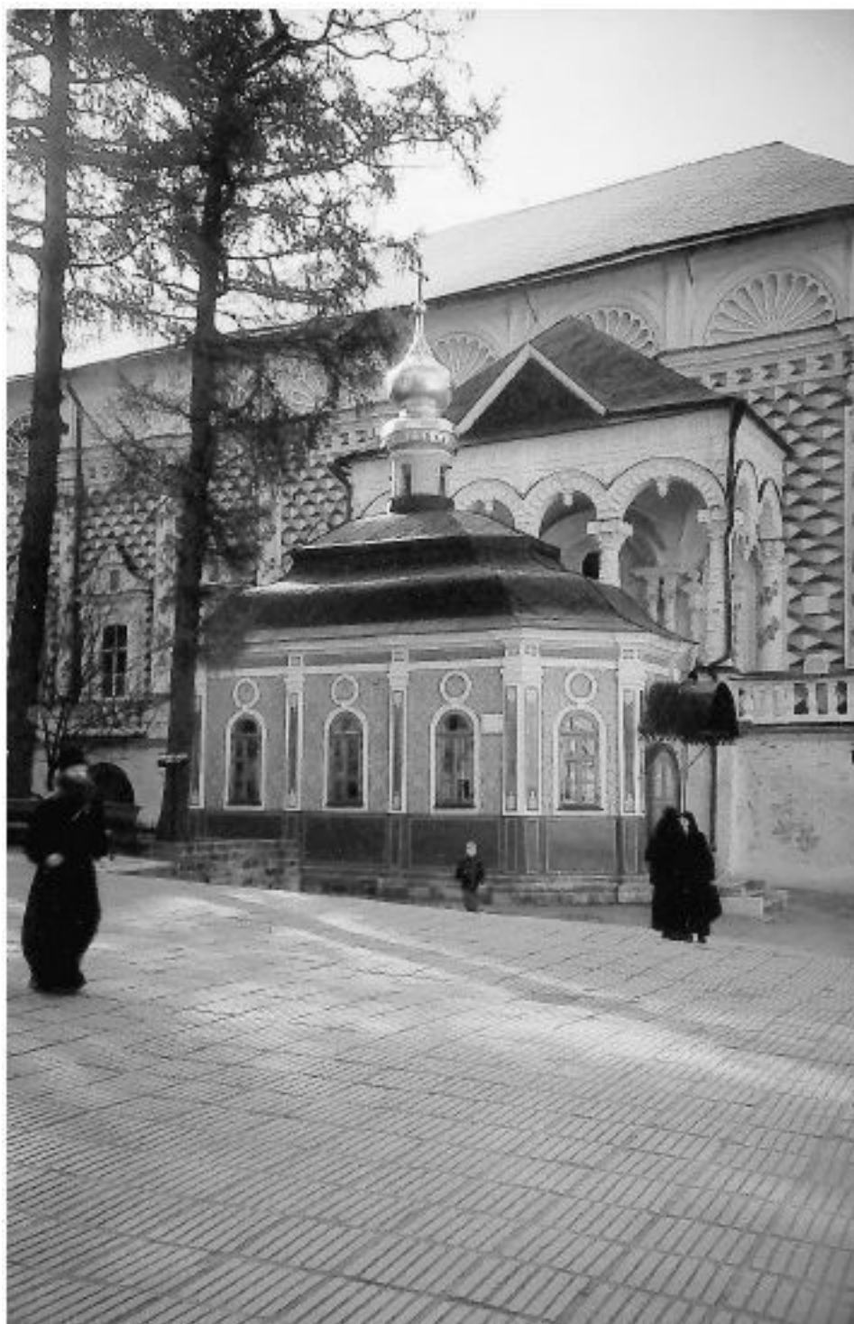
Троице-Сергиева лавра. Современный вид

я то, что переживала и чем теперь живет моя душа, какими словами выскажу я то, что преисполнило и преисполняет мое сердце. Я так бесконечно богат небесными благодатными сокровищами, дарованными мне чудодарительною десницей Господа, что, правда, и не в состоянии сосчитать и половины своего богатства. Монах я теперь. Как это страшно, непостижимо и странно! Новая одежда, новое имя, новые, доселе неведомые, никогда неведомые думы, новые, никогда не испытанные чувства, новый внутренний мир, новое настроение, весь я новый до мозга костей. О, какое дивное и сверхъестественное действие благодати. Всего переплавил она меня, всего преобразила...»