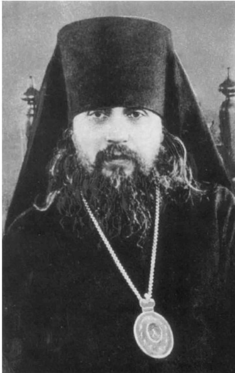
Епископ Арсений (Жадановский)

Епископ Арсений ежедневно служил Божественную литургию в домовая церкви, а его сомолитвенник пел и был за чтеца. В свободное от Богослужений время отец Серафим, в подражание своему небесному покровителю Преподобному Серафиму Саровскому, читал Священное Писание – в неделю все четыре Евангелия и Апостольские послания. Летом занимался огородом, рубил дрова. Владыка Арсений рисовал. Батюшка Серафим приручил птиц, которые во множестве жили вокруг киновии. Они вскоре настолько привыкли к нему, что слетались