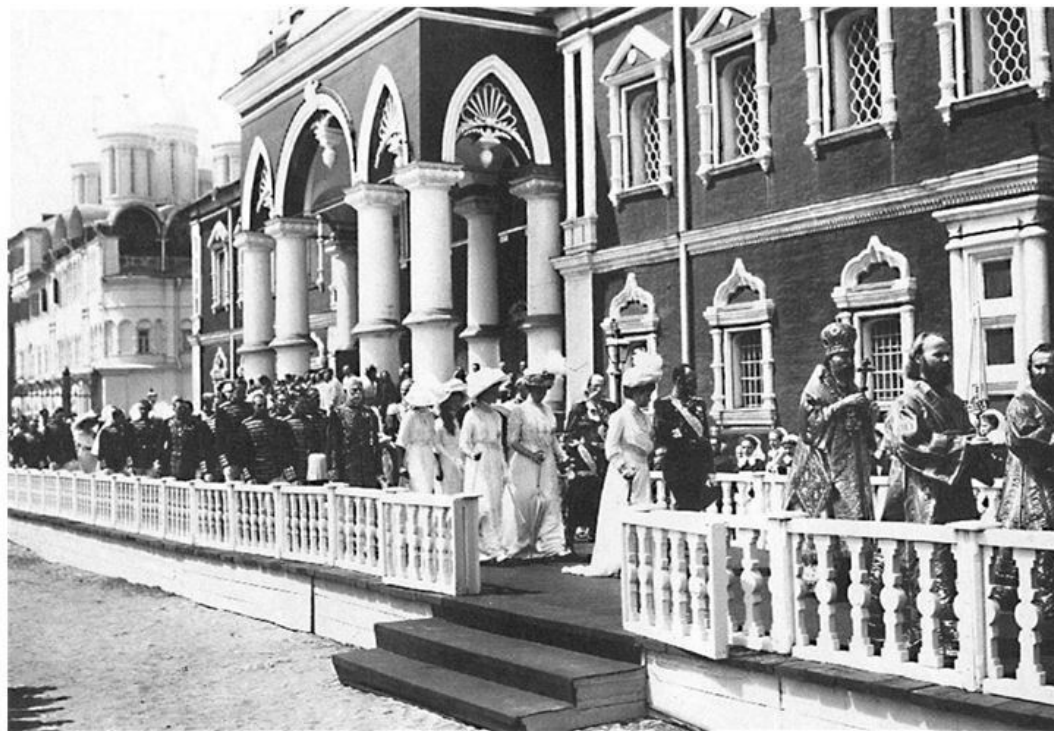
Чудов монастырь. Приезд Императорской Семьи. Впереди – братья обители