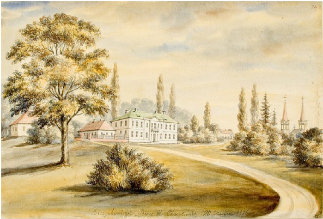
Дворец Хрептовичей в Бешенковичах. Худ. Наполеон Орда