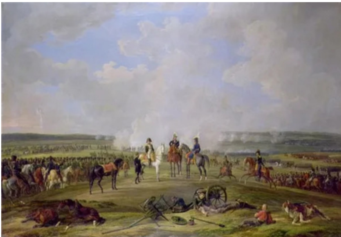
Альбрехт Адам – Наполеон и его войска в Бешенковичи, 24 июля 1812 холст, масло.

«Во время войны 1812 года в Бешенковичах находился гарнизон Наполеона Бонапарта. В октябре 1812 г. русские войска во главе с генералом Витгенштейном освободили Бешенковичи от французов. Памятником о прошедших боях в Бешенковичах стала сохранившаяся до наших дней „Батарея“. Так местные жители назвали земляной вал на правом берегу Западной Двины, подковообразной формы, открытый в сторону реки, длиной около 800—900 метров. На гребне этого вала люди пробовали копать и обнаружили человеческие кости». [3]