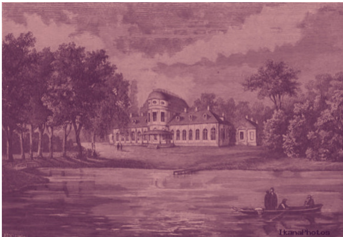
На фото дворец Хрептовичей в Щорсах в начале прошлого века.

Достопримечательности и памятные места [1]: