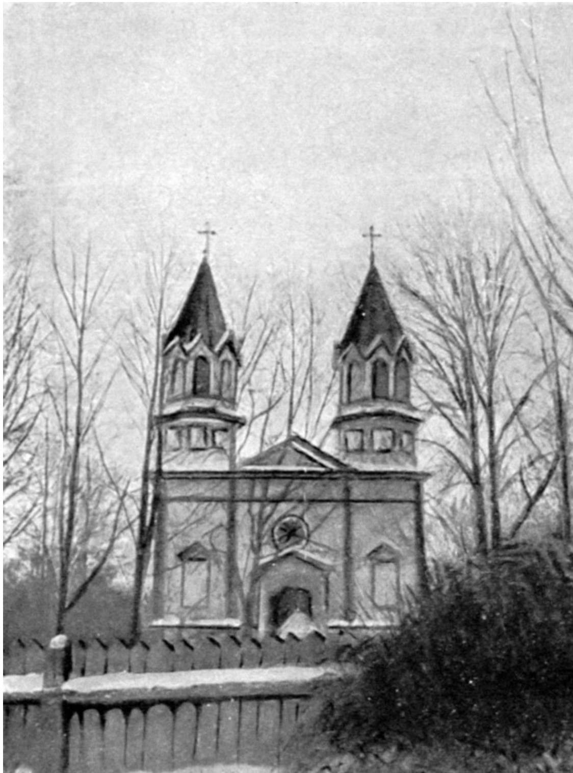
Римско-католическая церковь св. Казимира и Рафаила, нач. XX века. Утрачена

В 1634-м г. (или в 1650) в Бешенковичах было завершено возведение первой, выполненной из дерева церкви [1]: