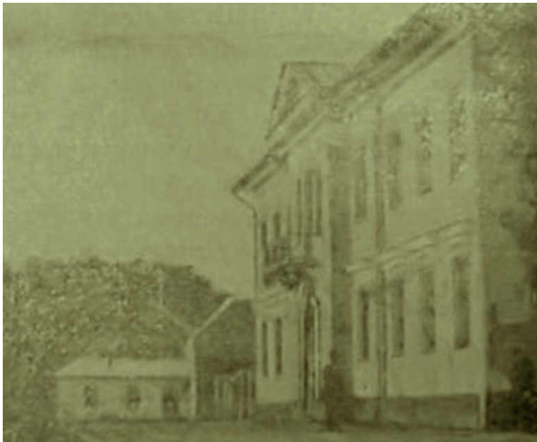
Бешенковичи. Дворцово-парковый ансамбль Хрептовичей.