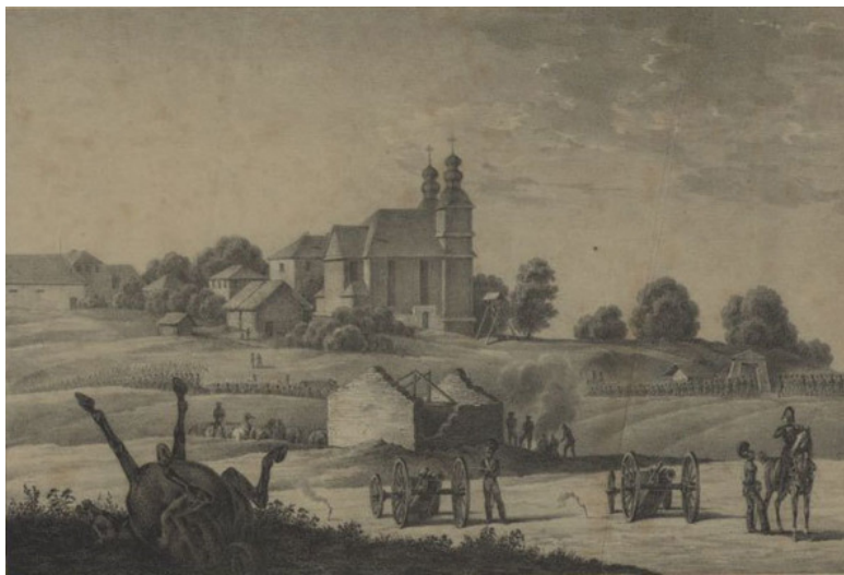
Старые фото Бешенковичей. File: Віе́шанкові́чы,

претендовать на звание коренного населения не меньше, чем потомки Франциска Скорины. В годы ВКЛ представителей этого народа называли литваками, а в наши дни именуют просто евреями. К началу XX века они составляли 50% населения крупных городов, а через каких-то 30—40 лет были массово репрессированы и уничтожены нацистскими и советскими карателями. Но память о еврейской Беларуси живет и поныне». (Вячеслав Корсак. «В поисках мультикультурной Беларуси: еврейское кладбище, невидимые люди и таинственный лес») [4]