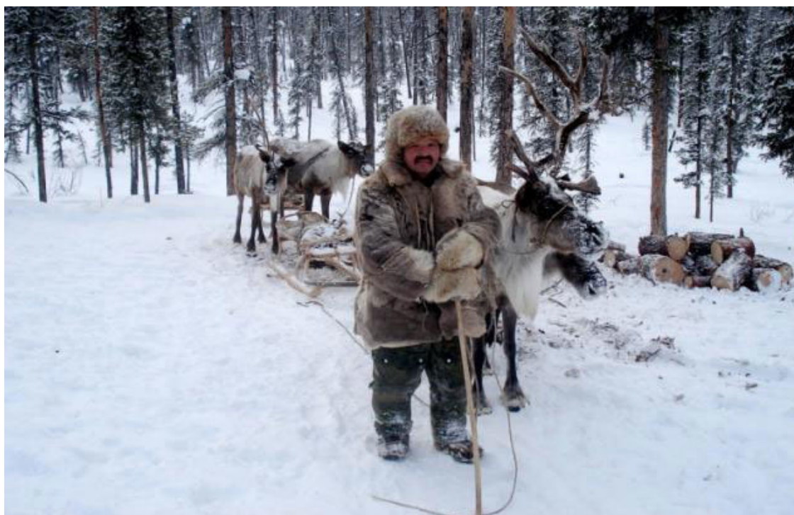
Рис. 5. Оленеводы эвенки