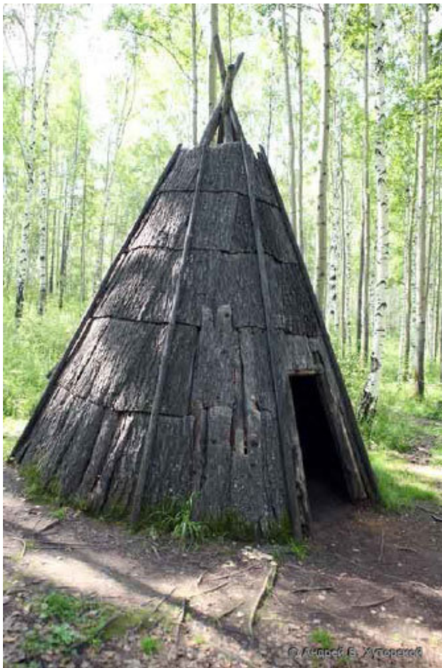
Рис. 7. Жилище эвенков (тунгусов), которое называется чум

Привожу значение некоторых эвенкийских слов (хорошо, когда в разговоре с незнакомым народом ты вдруг понимаешь некоторые слова, обращённые к тебе).