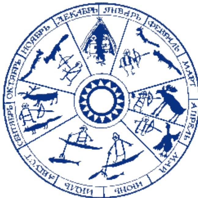
Рис. 4. Годовой цикл жизни эвенков 18-19 веков

Ещё в 18-19 веках эвенки жили по собственному годовому циклу: