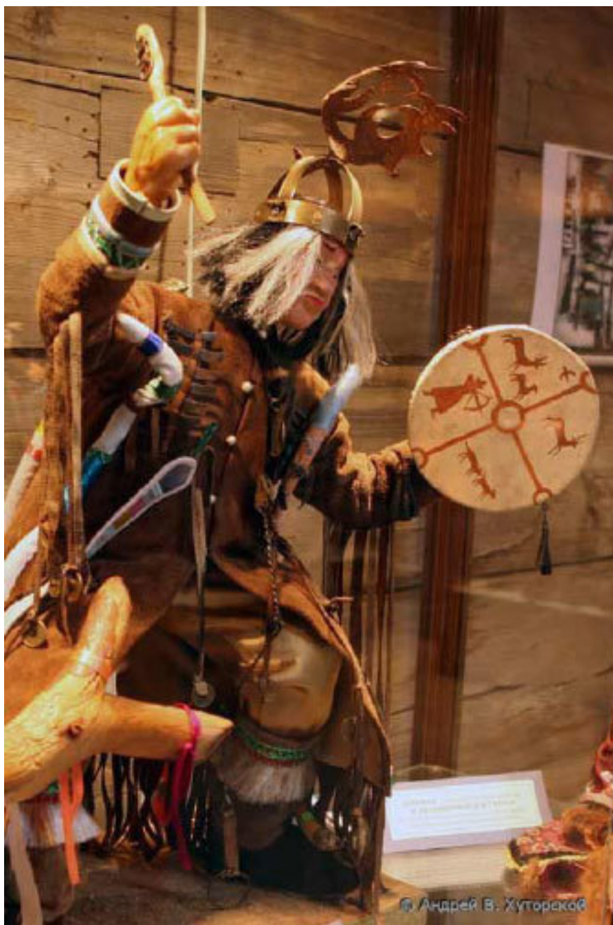
Рис. 3. Шаман

Шаманство , шаманизм – ранняя форма религии у большинства народов, возникшая при первобытнообщинном строе. Основана на вере в общение шамана, находящегося в состоянии ритуального экстаза (камлание), с духами. Формы камлания, представление о духах, степень специализации шаманов различались у отдельных народов. У некоторых народов шаманство пережиточно сохранялось в условиях классового общества. Сложные формы шаманство приобрело у народов Сибири (тувинцы, эвенки, якуты и др.). Камлание сибирских шаманов, одетых в специальные костюмы, сопровождалось ударами в бубен, исступлёнными плясками, гипнозом, разными фокусами, чрево вещанием и представляло собой как бы путешествие в мир духов (иногда на «коне» или «олене», которым считался бубен), борьбу с ними. Профессиональные шаманы были нервными, легко возбудимыми людьми, способные вызвать у себя состояние экстаза и галлюцинации, протекавшее в форме саморегулируемого припадка.