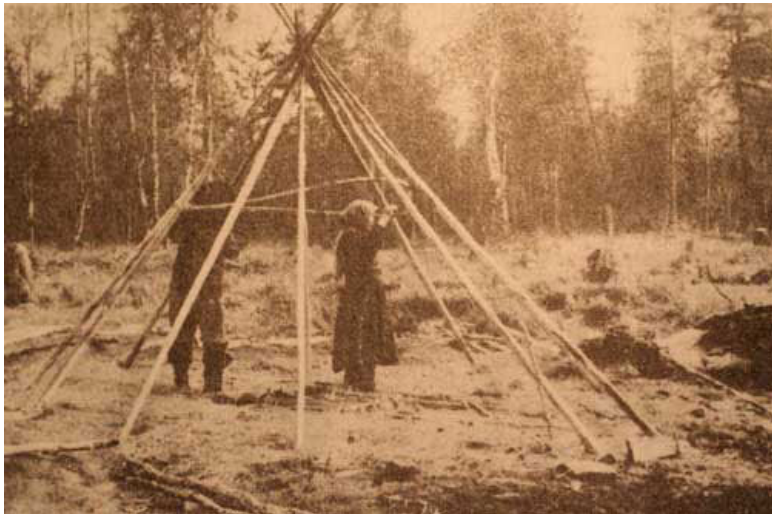
Рис. 2. Установка чума

Сравните чум – жилище нганасан и чум эвенков – вы обнаружите много общего. В таком чуме я жил у нганасан на плато Путоран, на Таймыре и описал его в дневнике Озёрный сиделец (читай дневник).