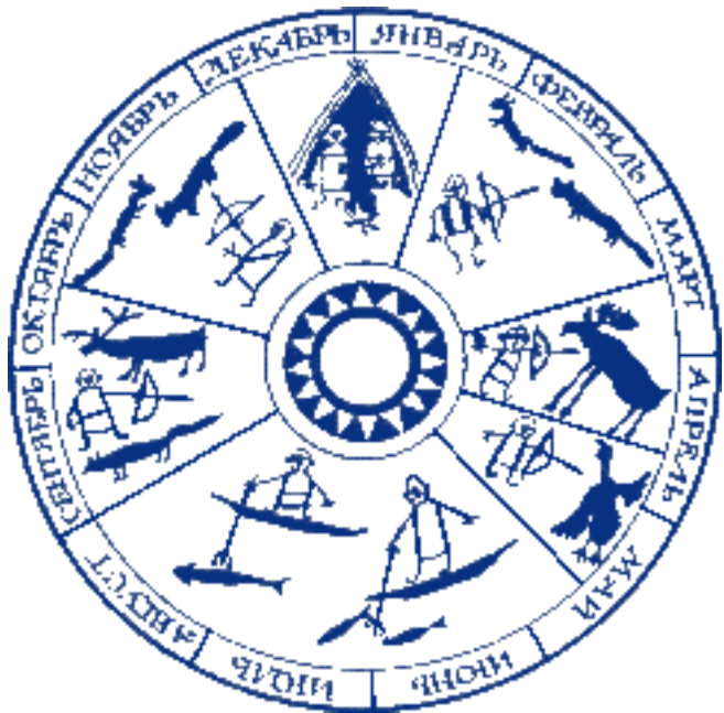
Рис. 4. Годовой цикл жизни эвенков 18-19 веков