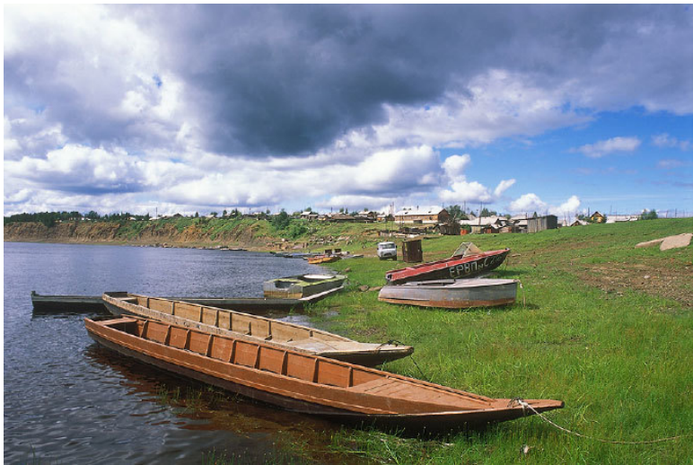
Рис. 9. Ванавара. «Центр тунгусской цивилизации»

На новой встрече мы обсуждаем все вопросы по снаряжению, сроках выхода на маршрут, состав продуктов, делим обязанности, да и просто говорим о том, что нас может ждать на реке. Особое напряжение вызвало обсуждение разделения обязанностей на маршруте, это было заметно по Лене. Я всё понимал и чтобы это напряжение снять, а её успокоить, предложил обсудить мои обязанности.