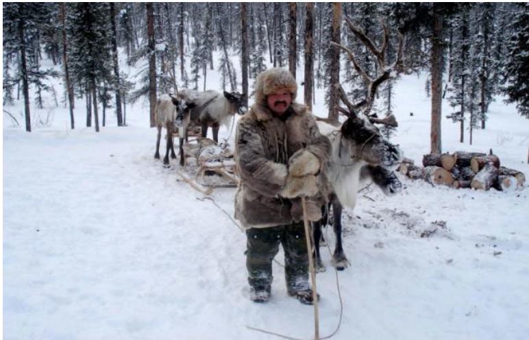
Рис. 5. Оленеводы эвенки