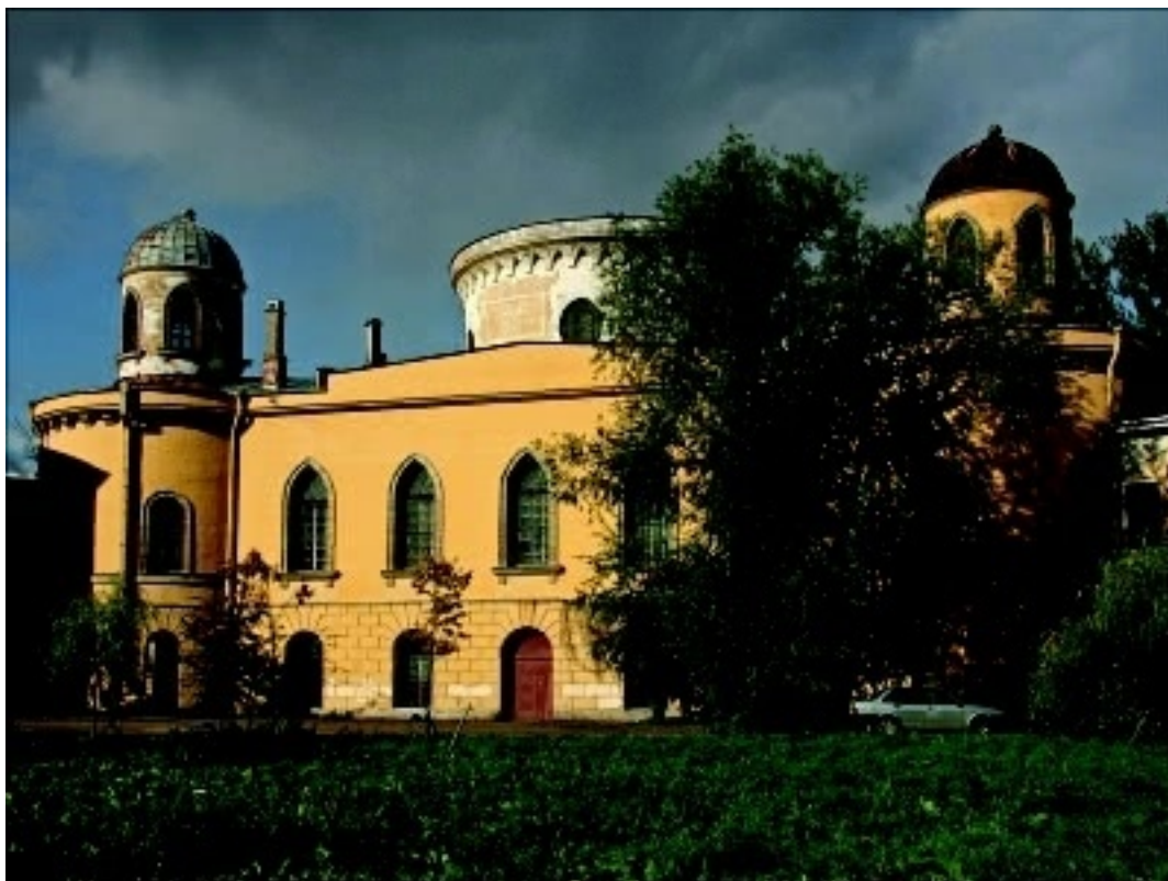
ЛИАП. Младшие курсы

Оба корпуса нашего института сыграли роковую роль в жизни Распутина. Напротив корпуса для студентов старших курсов (Герцена 67), как свидетельствует история: «Мойка дом № 92, в декабре 17-го дня, 1916 года, во дворце графа Юсупова, убили Распутина». А, здесь (Гастелло 15) в корпусе для студентов младших курсов: «В декабре 20-го дня, 1916 года, лазарете Чесменской богадельни, состоялось вскрытие и обследование трупа Распутина».