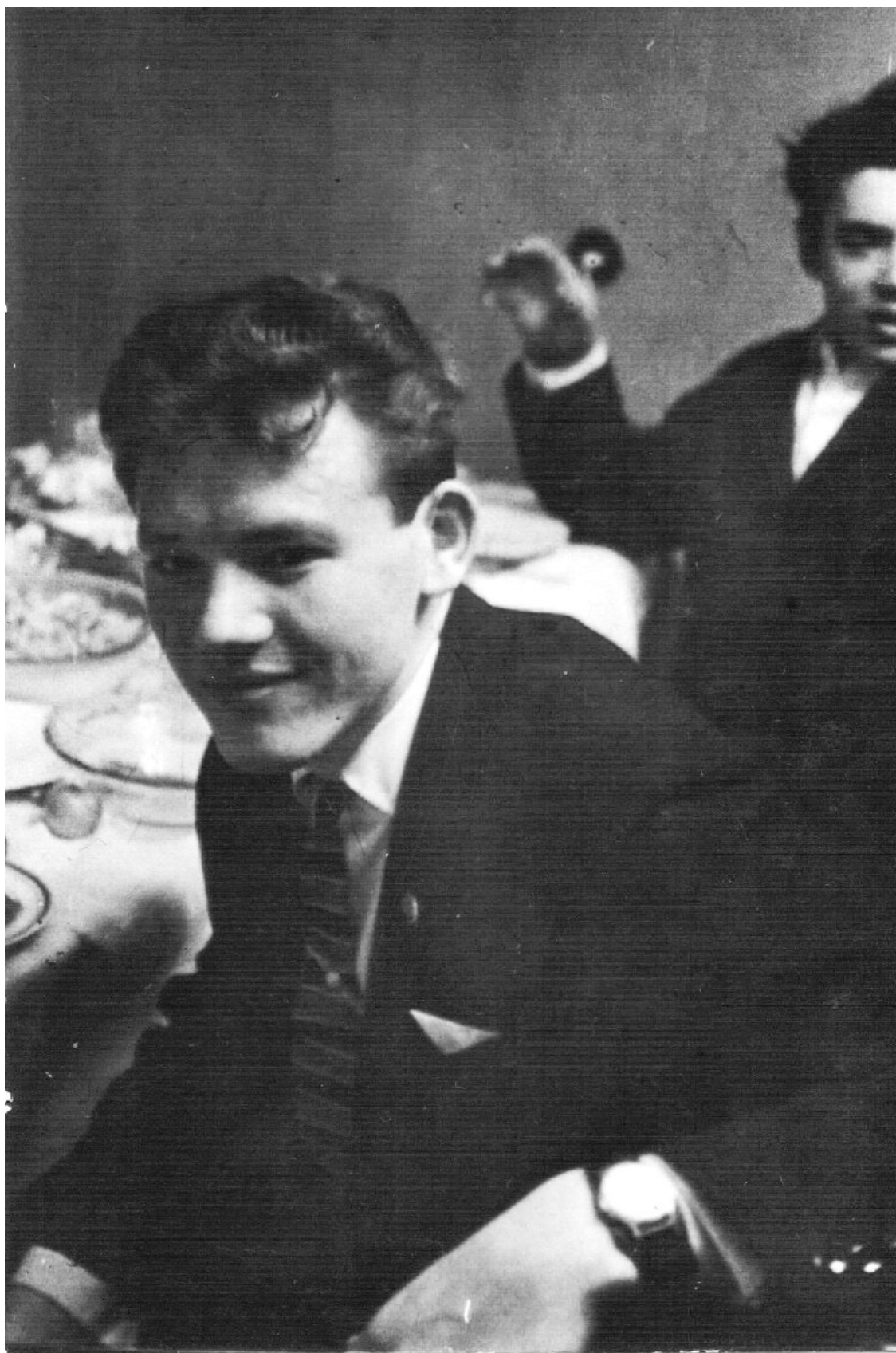
Николай Михайлович в размышлении. Правильно ли сделал, оставив все завоёванные тех- никумом блага? Конечно да!