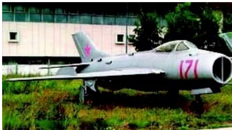
МИГ-19. Скорость 1452 км/час. Потолок 17.500 м.