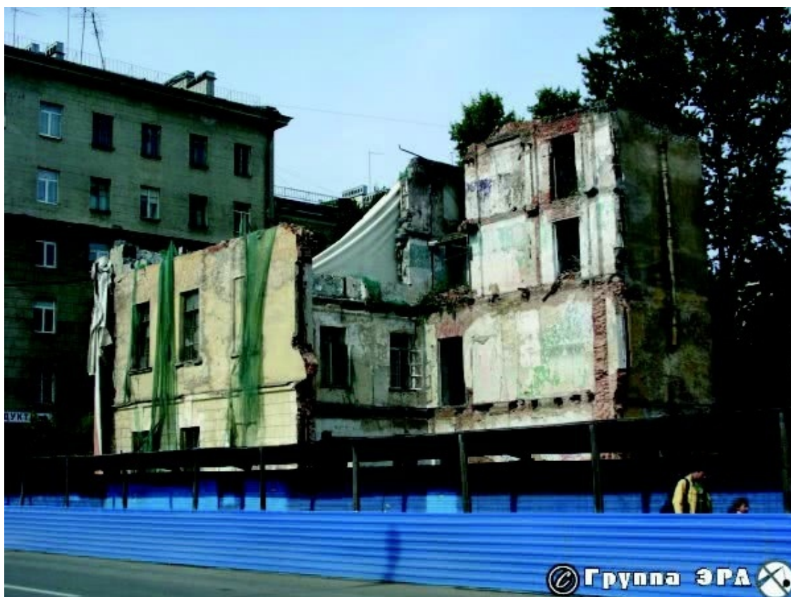
Прощальный взмах платком для нас, жителей общежития.