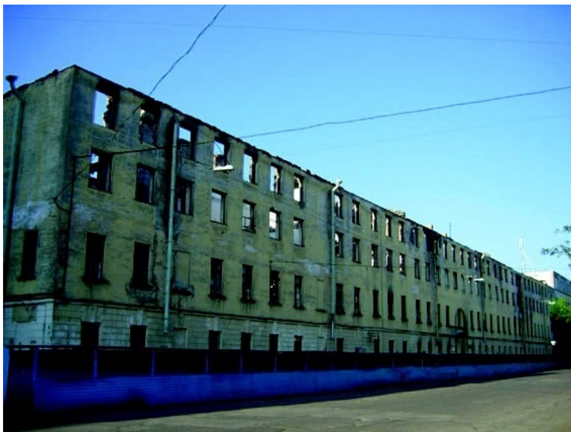
Гастелло 16. Когда-то здесь кипела бурная, насыщенная жизнь!