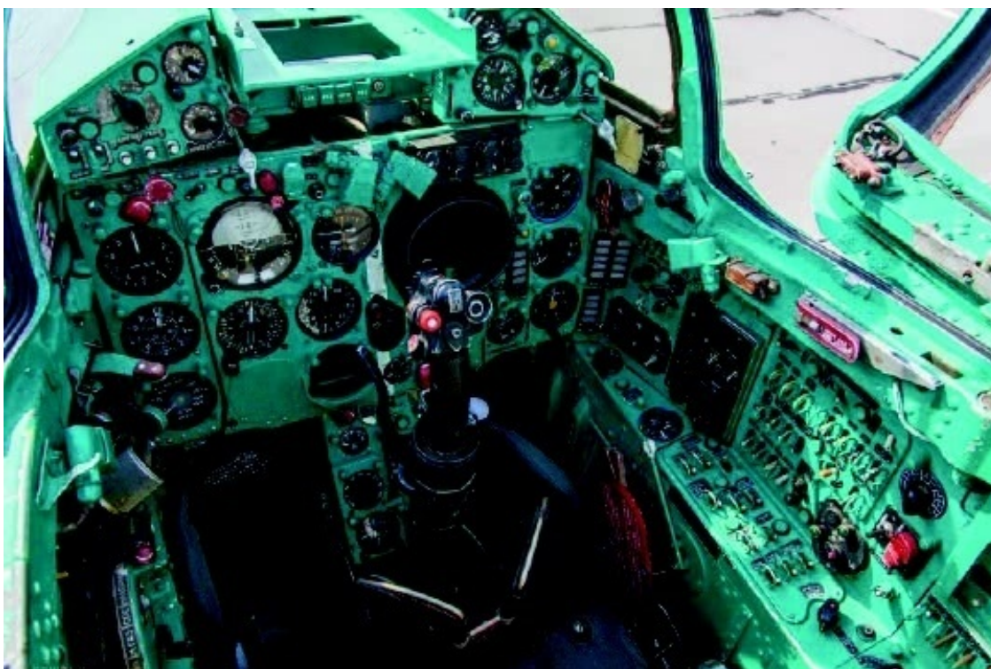
МИГ-21. Приборы управления

Она спросила и была удивлена. Как, оказывается, можно доходчиво изложить что-то сложное! При этом неизбежно сохранить главное, которое со временем будет обрастать более глубокими и сложными знаниями.