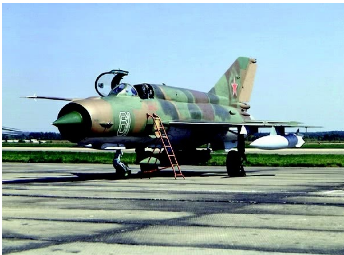
Самолёт МИГ-21. Скорость 2125 км/час. Потолок 19.000 м.

Даже не просвещёному человеку понятно, что модель МиГ -21 совершеннее. Ну, а для нас ЛИАПовцев тем более. Чего стоит только один конус в приёмном диффузоре МиГа-21, по сравнению с МиГом-19! Это же часть БРЛС (бортовая радиолокационная система) и регулирование воздействия знаменитого «скачка уплотнений» при полёте этой машины на сверхзвуковых скоростях! У МиГа-21 она была больше, чем у МиГа-19. Скорость у него была 2«М» (два «Маха», т. е. две скорости звука). При переходе через сверхзвуковые барьеры возникают «скачки уплотнений» и этот конус выполнял очень важную задачу.