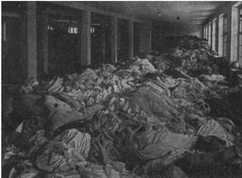
Освенцим. Склад одежды. Архивный снимок.