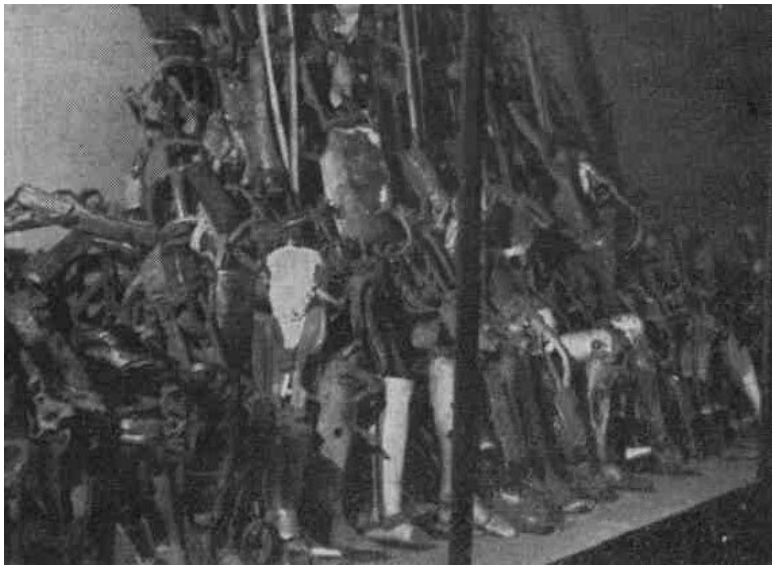
Освенцим. Корпус 5. Часть зала N 5.

Кроме того, было найдено огромное количество зубных щеток, кисточек для бритья, протезов, очков и др. предметов.