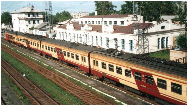
Современный вид станции Верещагино.