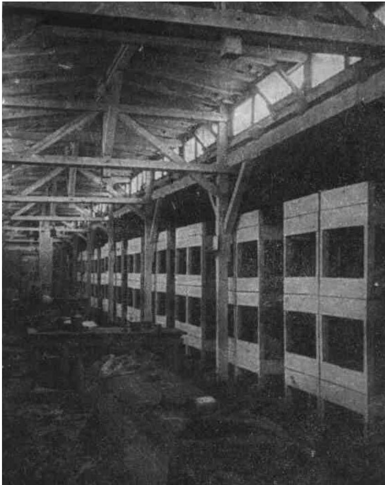
Внутренний вид деревянного барака.