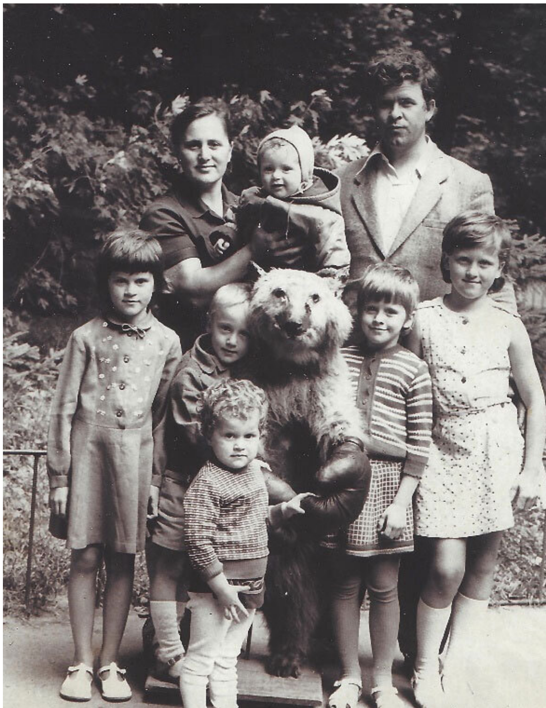
Наша семья. Я вторая справа в нижнем ряду.

Вера моих родителей учила их иметь столько детей, сколько Бог им даст. Родители беспокоились о том, как они смогут обеспечить детей финансово. Но шли годы и у них в Украине родилось ещё четверо детей, и всех нас они смогли обеспечить.