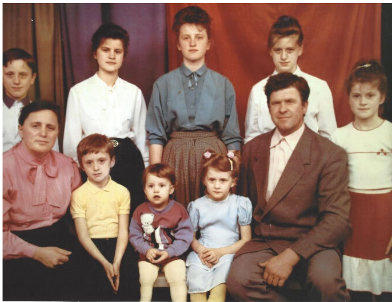
Наша семья. Я вторая справа в верхнем ряду.