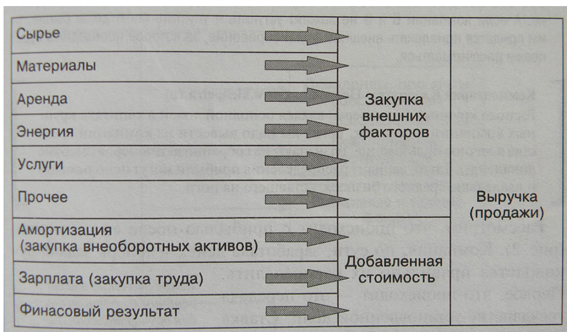
Рисунок 1. Образование добавленной стоимости и прибыли компании

Добавленная стоимость фактически остается в компании, только часть ее уходит на поддержку прежнего объема внеоборотного капитала, если компания хочет оставаться с прежними мощностями (амортизация), часть – на оплату труда (зарплата, которая зависит от рыночных цен на оплату труда по данным профессиям в данном регионе), а часть добавленной стоимости остается в распоряжении компании и является главным источником внутреннего финансирования.