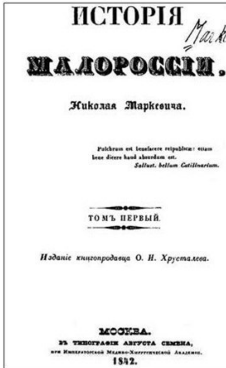
Титульний лист книжки М. Маркевича «Історія Малоросії». 1842 р.

Максимович спробував створити першу наукову біографію Сагайдачного. У 1850 р. в альманасі «Киевлянин» він опублікував роботу «Сказання про гетьмана Петра Сагайдачного». При написанні її використовував широке коло джерел, у тому числі «Вірші на жалісний погреб... Петра Конашевича-Сагайдачного...» Касіяна Саковича.