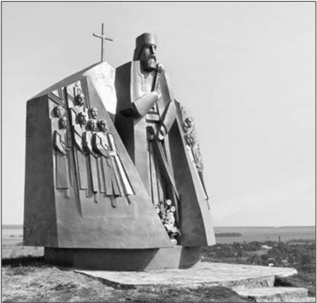
Пам'ятник Петрові Сагайдачному в Хотині

української війни, у 2017 р., в районному центрі Донецької області Мангуш полк «Азов» відкрив пам'ятник Сагайдачному. Тим самим бійці цієї військової формації хотіли продемонструвати, що Приазов'я, яке хотіли захопити проросійські сепаратисти, є українською землею. Пам'ятники Сагайдачному свого часу були також відкриті у тих місцях, які пов'язані з діяльністю цього полководця – у Хотині (1991) та в Києві на Подолі (2001). Створений був також у 1992 р. музей Сагайдачного в селі Кульчиці Самбірського району Львівської області, де також встановлено пам'ятник. Поширена гіпотеза, що ніби саме там народився козацький гетьман. Іменем Сагайдачного названа Національна академія сухопутних військ у Львові, Київський інститут водного транспорту, Запорізький інститут Міжрегіональної академії управління персоналом. У 2010 р. Верховна Рада України прийняла постанову «Про відзначення 440-річчя з дня народження гетьмана Петра Сагайдачного». Наступного ж року архієрейський собор Української автокефальної церкви канонізував цього діяча в чині «благовірний гетьман». Видано в Україні також низку книг про Сагайдачного.