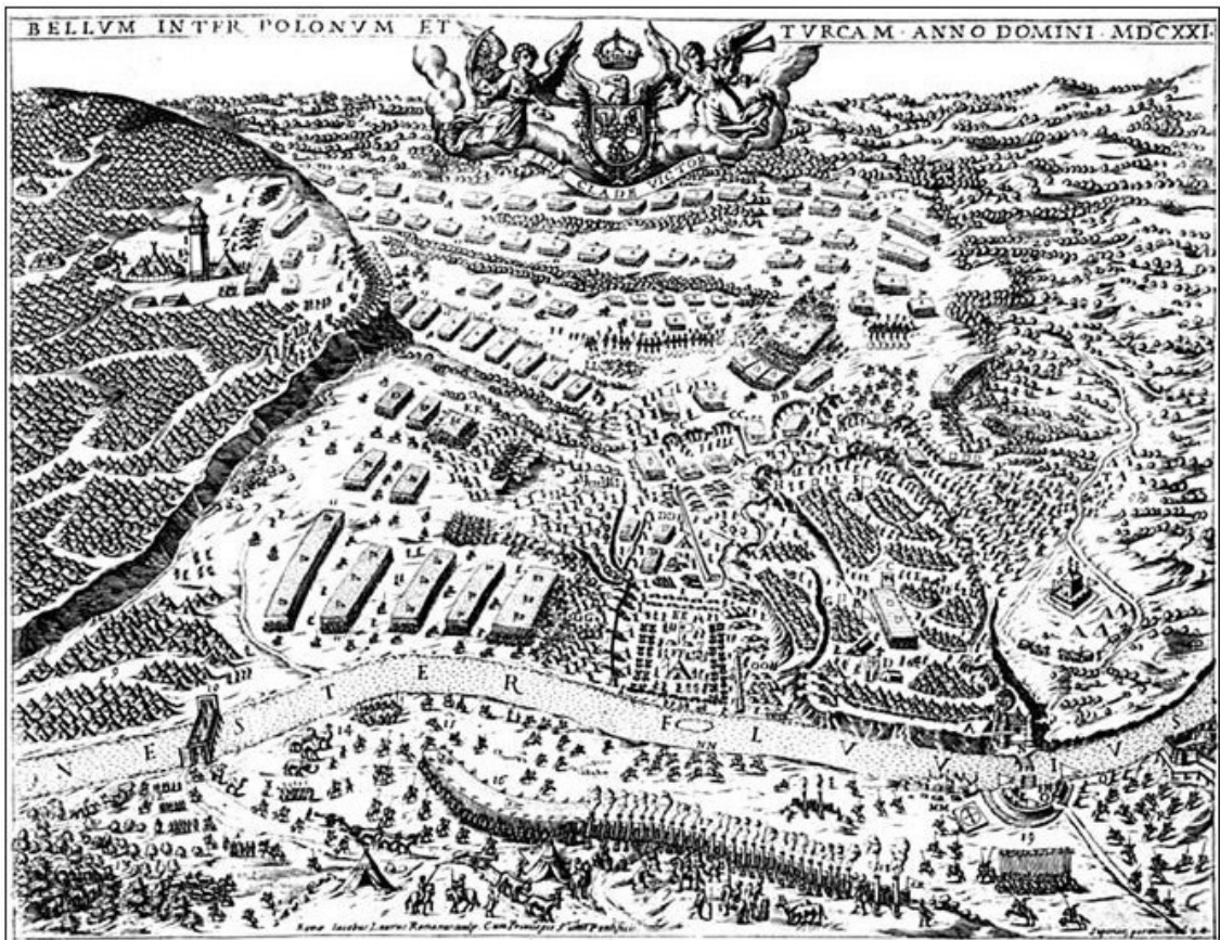
Джакомо Лауро. «Хотинська битва». 1621 р.

Цим «Вірші...» принципово відрізняються від тодішніх творів про битву під Хотиним. Зрозуміло, в польських творах про цю подію акцентувалася увага на ролі шляхетського війська. Хоча й були згадки про запорозьких козаків. Переможцем у цих творах поставав королевич Владислав, який формально очолював збройні сили Речі Посполитої в цій битві. Таким він постає і в історичних хроніках того періоду. Те саме можна сказати і про відому поему барокового поета Івана Гундулича (1589—1638) з Дубровника «Осман».