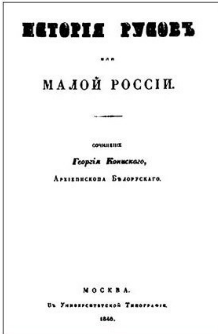
Обкладинка книги «Історія русів»

Інформація про цього козацького провідника в «Історії...» не завжди точна. Ставитися до неї варто обережно. Однак заслуговує на увагу образ Сагайдачного, представлений у цьому творі.