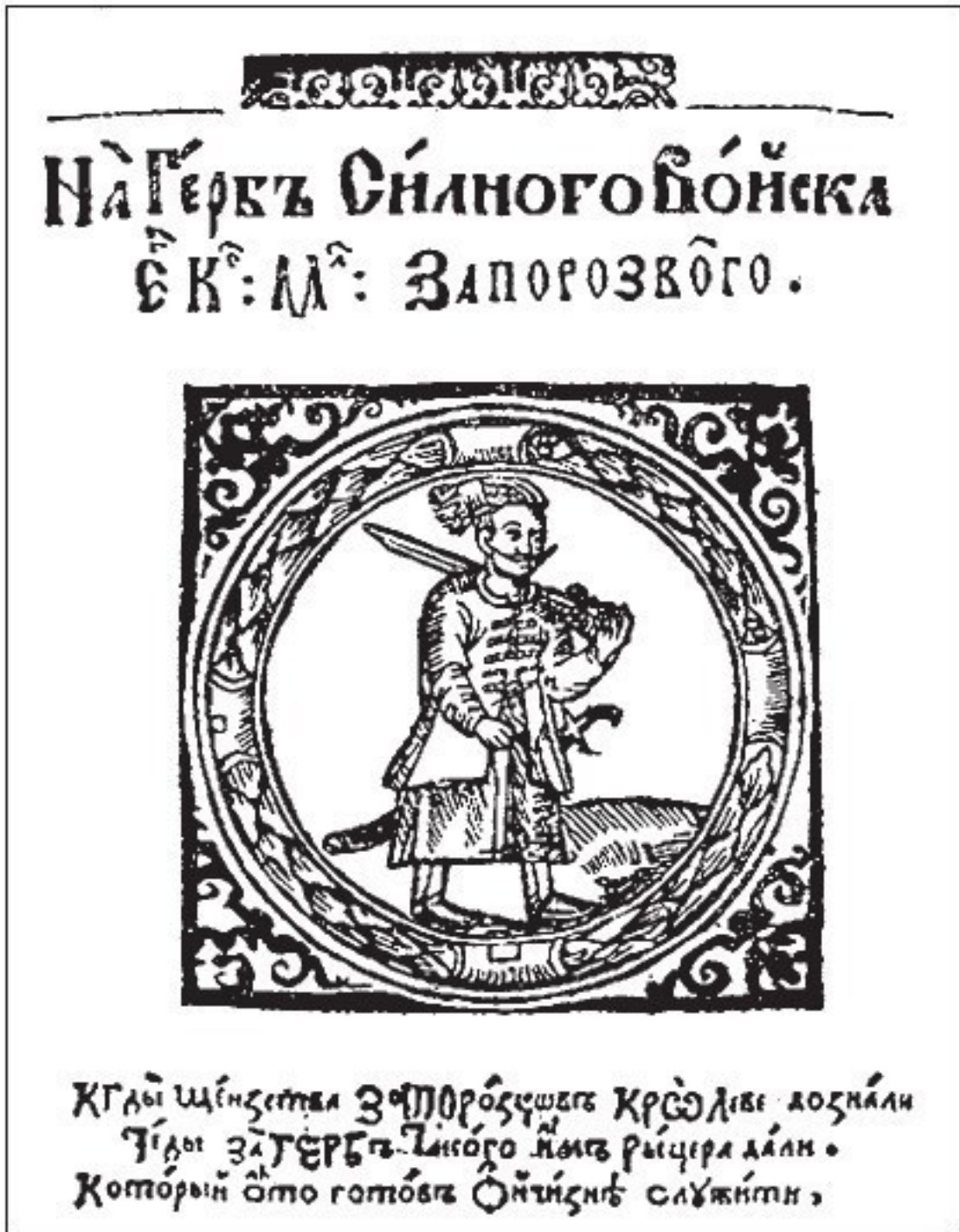
Портрет Петра Конашевича-Сагайдачного із книги віршів К. Саковича. 1622 р.

Виглядало парадоксально. Поетичний «пам'ятник» гетьману Сагайдачному, який відіграв важливу роль у збереженні православ'я на українських землях, створила людина, котра зрадила православ'я й у кінцевому результаті опинилася в таборі «латинників».