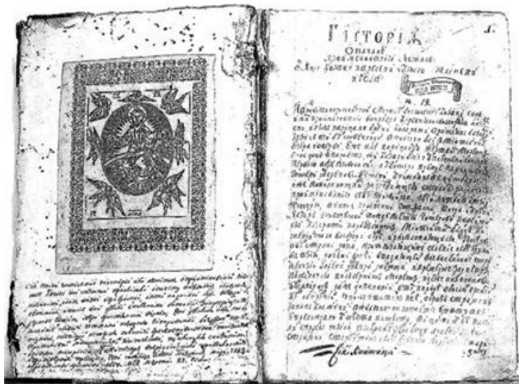
Літопис Григорія Грабянки

серед підписів представників Гадяцького полку. Після передачі чолобитних Грабянка разом з Павлом Полуботком та іншими представниками старшини восени 1723 р. був арештований та ув'язнений у Петропавлівській фортеці. Звідти його звільнили лише після смерті Петра І. Після звільнення Грабянка став полковим обозним, а з 1730 р. – гадяцьким полковником. Загинув під час кримського походу на татар у 1738 р.