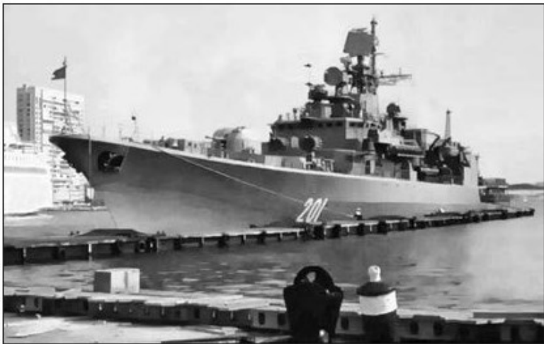
Фрегат «Гетьман Сагайдачний». 1994 р.

На честь цього полководця був названий флагман Військово-Морських Сил України, фрегат «Гетьман Сагайдачний». Пам'ятник Сагайдачному був поставлений у Севастополі в 2008 р. Це була одна з ознак української присутності в Криму, яка викликала невдоволення в російських шовіністів. Не дивно, після російської окупації півострова в 2014 р. цей монумент був демонтований і переданий до Харкова, де його встановили 5 . Зате під час російсько-української війни, у 2017 р., в районному центрі Донецької області