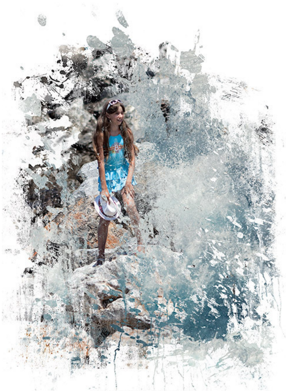
«Дельфин и Дельфина»