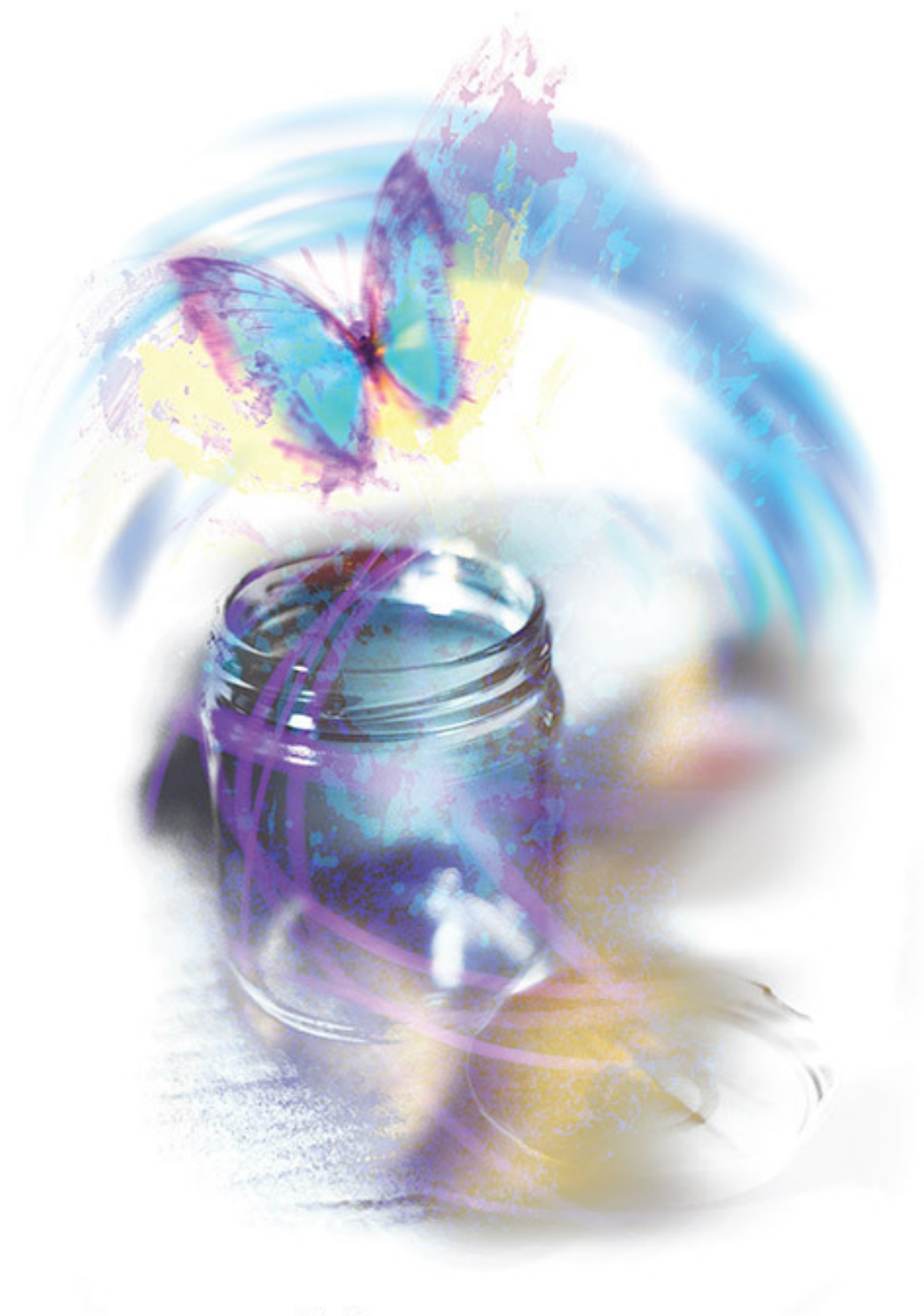
«Бабочка и мотыльки»