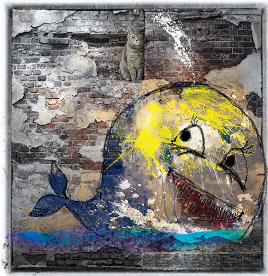
«Кот и Кит»