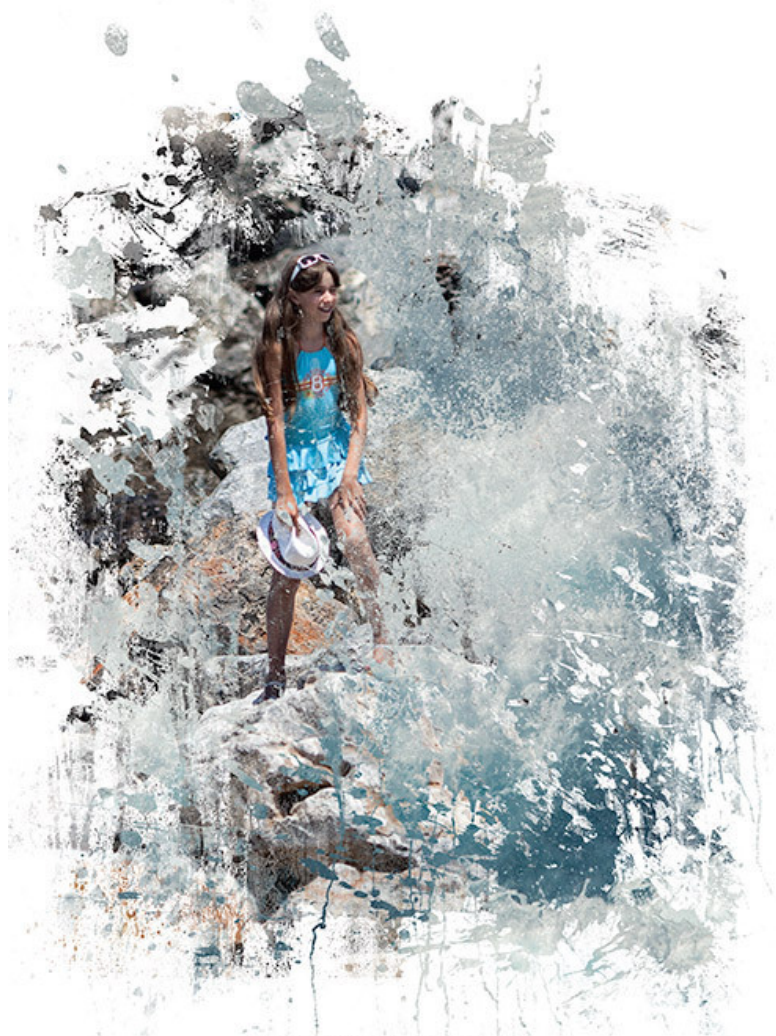
«Дельфин и Дельфина»