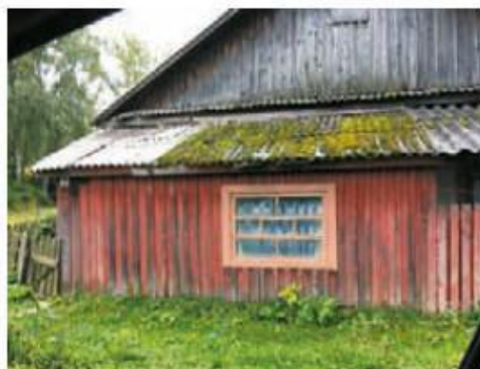
Поселок сейчас. Барак, увы, не сохранился.