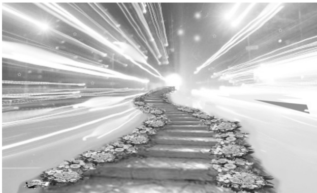
Рис. 2. Образ «дорог»: соматогенеза, психогенеза, социогенеза сексуальности

исходит отрыв психического от соматогенеза и социогенеза сексуальности.