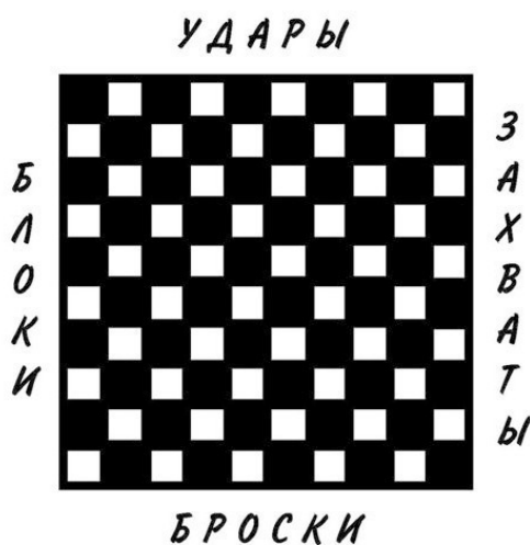
Доска для стоклеточных шашек

Большое внимание в УКБ Агни Кэмпо уделяется самообороне личности и её выживанию в экстремальных ситуациях. Мы понимали, что чем больше количественный показатель знаний человека в области самообороны, тем выше его избирательность перед лицом реальной опасности. Был проведён элементарный математический анализ, который показал, что если все технические элементы Агни Кэмпо выложить, например, на доску стоклеточных шашек, то их варианты дают десятки тысяч приёмов, которые можно применить во множестве жизненных ситуаций. Однако, для успешного применения полученных знаний, бойцу также необходима высокая стрессоустойчивость. Для этого мы создали специальные методы дыхания, техники концентрации в рамках нашего стилевого направления, которые проверены многими годами деятельности и медицинскими исследованиями. Можно утверждать, что мы создали собственную школу медитативной практики. Наши методы не только делают из человека хорошего бойца, но создают из него гармоничную личность, способную приносить пользу людям.