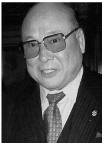
Основатель Кёкусинкай каратэ Сосай Масутацу Ояма