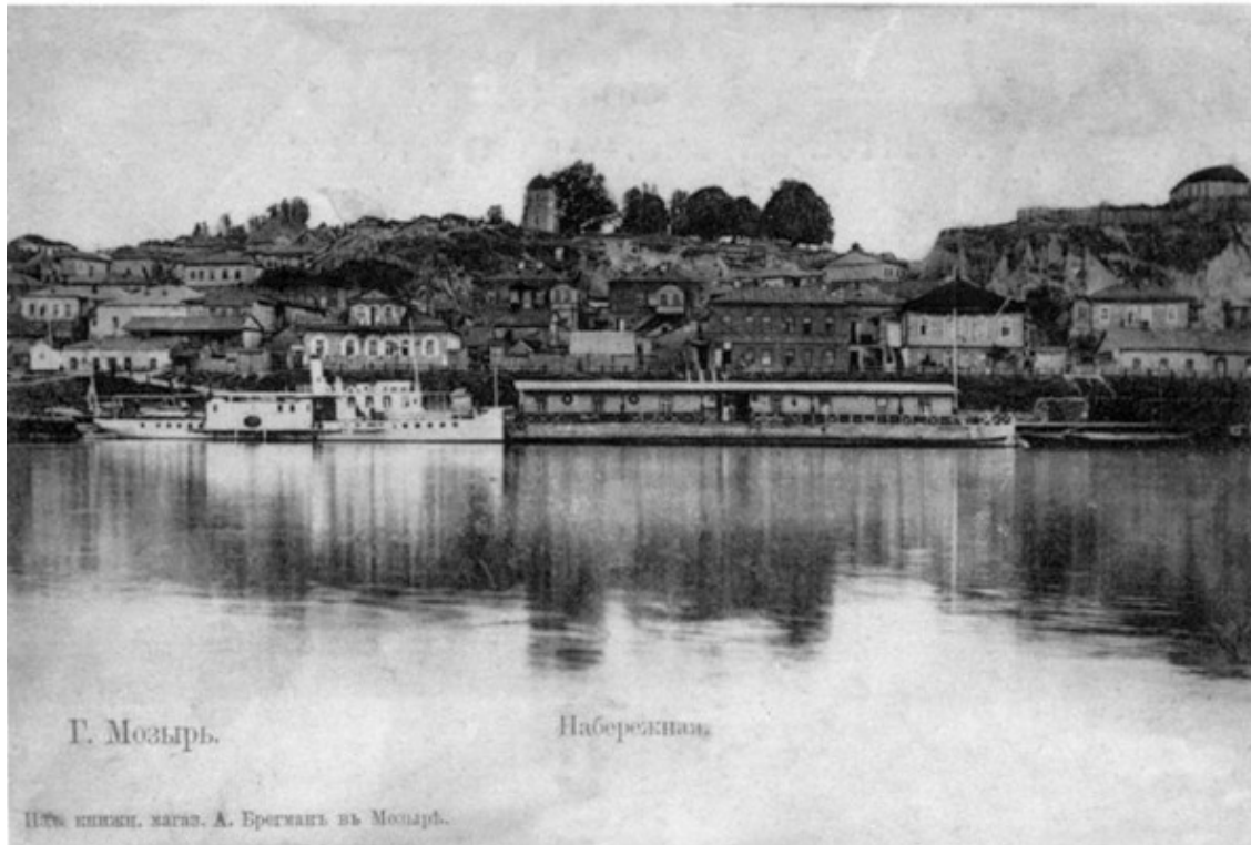
Фото из источника в списке литературы [5]

Мозырь всегда был городом, в который проникали важные исторические события, войны. Он был центром торговых путей, его хозяева не раз менялись. Не исключено, что он поначалу был «мазырем» («мазырь» – лакомый кусок) для древних князей. Местность его красивая и удобная в плане расположения торговых путей.