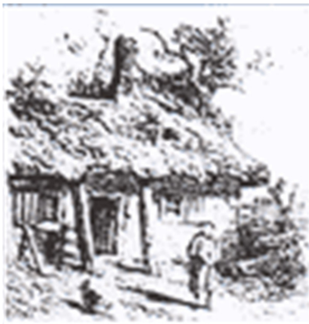
Полесская корчма. XIX век, перв. половина.

О мозырских евреях перед Первой мировой войной сведений не много. Но некоторые имеющиеся сведения довольно любопытны. Они содержатся в источнике «В. А. Лякин. «Мозырь в 1812 году» [16].