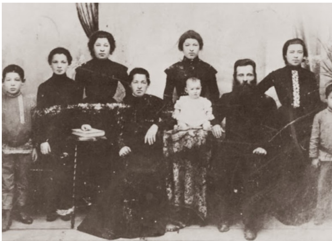
Еврейская семья из г. Мозыря. 20 в. – начало. Фото из источника в списке литературы [14]

В 1910-м году в городе было много синагог (восемь).