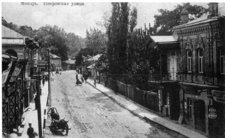
Фото из источника в списке литературы [115]

магазины и лавки (в количестве ста тридцати (из них тридцать семь были бакалейными, шестнадцать мануфактурных и восемь галантерейных). Единственным в Мозыре лесопромышленником был еврей.