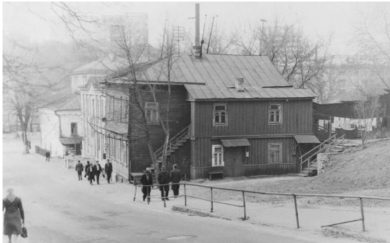
Фото из источника в списке литературы [10]

В 1924-м году Мозырь стал районным центром. Произошло его вхождение в Беларускую ССР. Он превратился в часть Беларуси, часть беларуского Полесья.