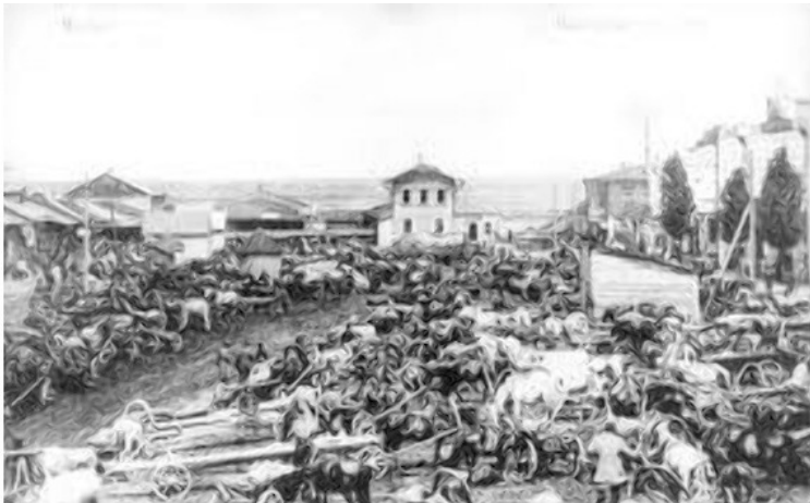
Фото из источника в списке литературы [6]

В 1615-м году в городе произошло восстание. В 1648-м году было восстание Хмельницкого. В 1649-м году Янушем Радзивиллом была устроена в городе большая резня.