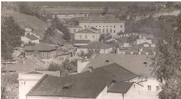
Фото из источника в списке литературы [11]

Началом истории евреев города Мозыря можно считать день его основания в 1155-м году. В одной из легенд название города связывается с евреями. Данная легенда содержится в книге «Гомельшчына ў лягендах і паданнях», Мінск,