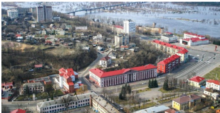
Фото из источника в списке литературы [3]

Минск (столица Беларуси) находится от него в двухсот двадцати километрах. А с восточной стороны в ста тридцати километрах находится белорусский город Гомель.