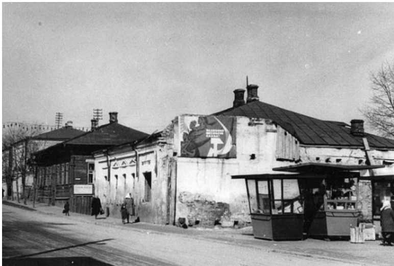
Фото из источника в списке литературы [9]

В конце 1917-го года (в декабре) в Мозыре произошло установление власти «советов». В 1918-м году его занимали германские войска. С зимы 1918-го года (с декабря месяца) по весну 1920-го года (по март этого года) имело место вхождение города в Украинскую НР.