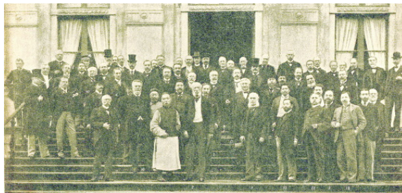
Делегаты 1-й Гагской конференции от 26 государств.

ными дипломатиями как наивность: конечно же, это не могло предотвратить стремление финансовой мировой «закулисы» к мировому господству и готовившуюся ею мировую войну – главным образом против России. Но этот почин русского Царя положил начало целому ряду действующих поныне конвенций о предотвращении жестоких способов ведения войны, о гуманном обращении с пленными и т. п.