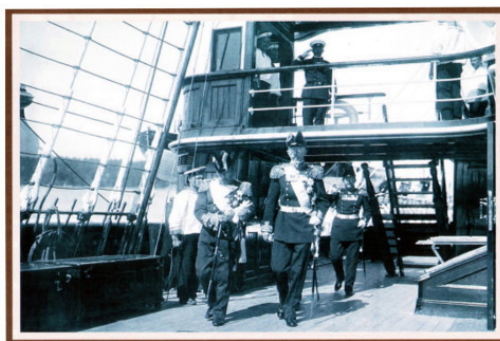
Король Швеции Густав V и император Николай II на «Штандарте». 1909.

Постоянно общался с постоянными представителями военных миссий, которые находились в ставке в г. Могилёве. Это были французский генерал, глава французской военной миссии Жорж Жанен, итальянский полковник глава итальянской миссии Марсенго Б., бельгийский генерал, глава бельгийской военной миссии, барон Рикель, британский генерал, военный представитель Хенбери – Вильямс, сэр Джон и многие другие. Надо отметить, что император, находясь неоднократно в поездках в такие страны как Германия, Англия, Франция, Дания, Швеция, Румыния до начала войны император знакомился с армиями других стран.