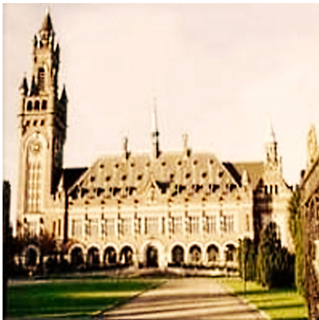
«Дворец Мира». Г. Гаага. Голландия.