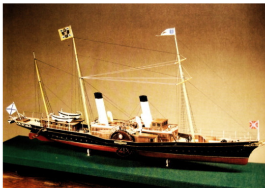
Императорская яхта Александрия