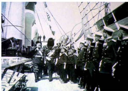
Фотография 1908 года. Английский король Эдуард VII и император Николай II обходят строй команды на яхте «Штандарт». К. Е. фон Гани. Рейд г. Ревеля. Каталог Русские императорские яхты. Издательство «ЭГО». Санкт-Петербург, 1997.