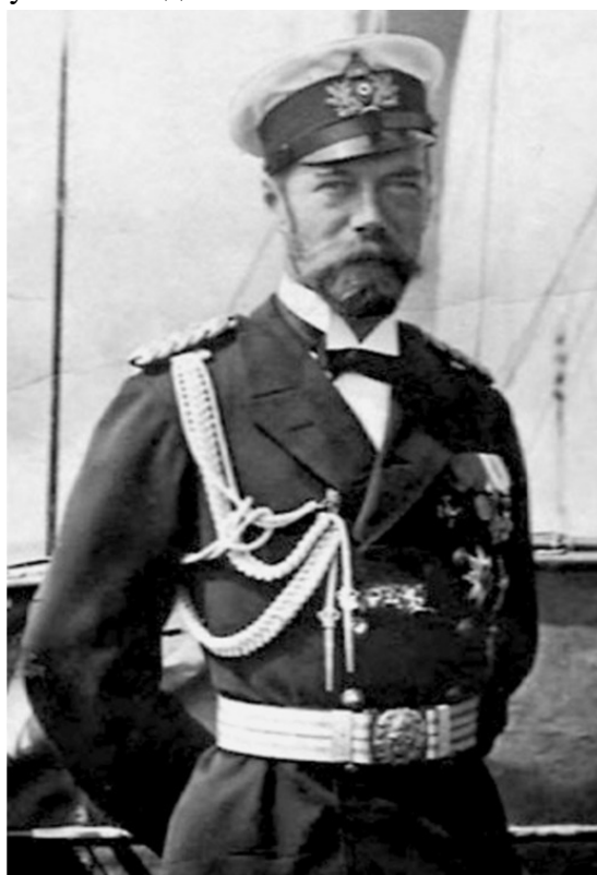
Император Николай II

Создано в интеллектуальной издательской системе Ridero