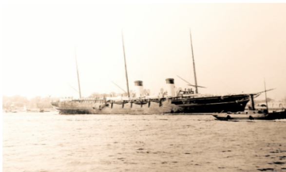
Императорская яхта «Штандарт» в Копенгагене перед выходом в Англию 8 сентября 1896 года.