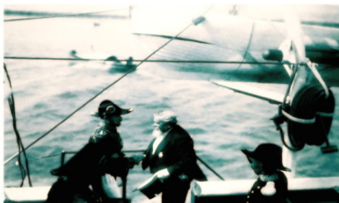
Император Николай II и французский президент Арманд Фаллиер на борту яхты «Штандарт». Ревель, 14 июля 1908. Неизвестный автор 23x17 см. ГАРФ Ф.601, Д. 754. Л. 31