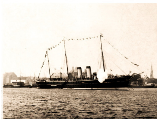
Яхта «Полярная Звезда».