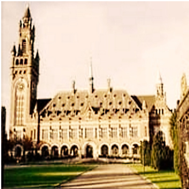
«Дворец Мира». Г. Гаага. Голландия.

Первая и главная цель конференции – сокращение вооружений и военных бюджетов или даже фиксирование их на уже сложившейся высоте – достигнута не была. Это было обусловлено исключительно позициями Германии и Франции. Позиция французской делегации на самой конференции вызвало у представителей Российской делегации далеко не однозначную реакцию. Один из главных участников