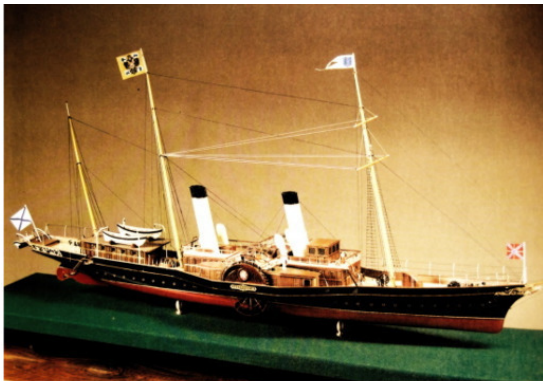
Императорская яхта Александрия