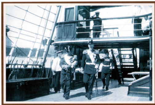
Король Швеции Густав V и император Николай II на «Штандарте». 1909. РГАВМФ Ф. 21. Оп. 1. Д. 44 л. 11.

Постоянно общался с постоянными представителями военных миссий, которые находились в ставке в г. Могилёве. Это были французский генерал, глава французской воен-