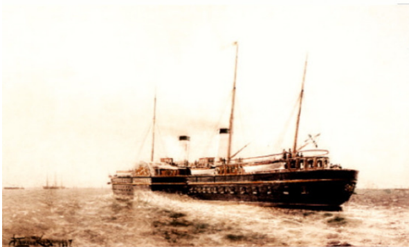
Императорская яхта «Держава» Художник М.С. Ткаченко