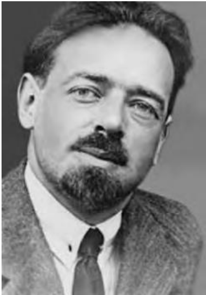
Рис. 1. Николай Бернштейн – основатель современной многоуровневой иерархической теории координа-