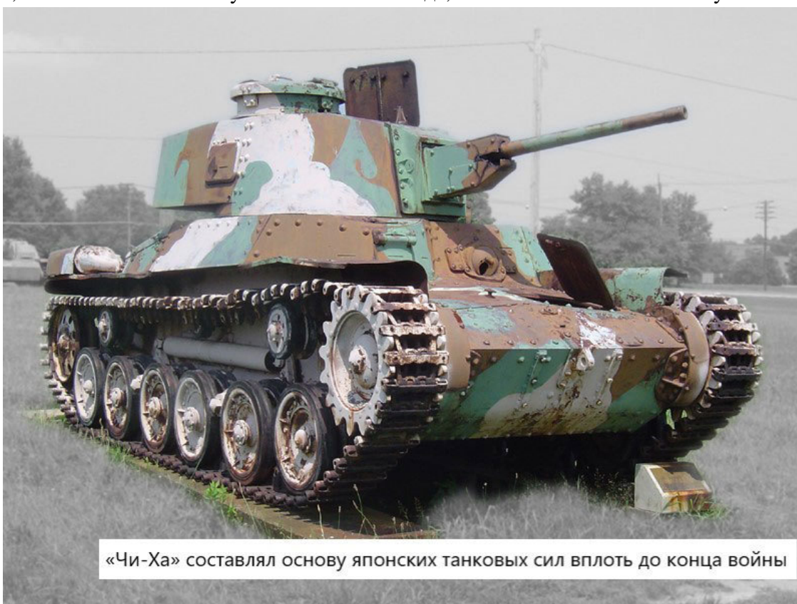
«Чи-Ха» составлял основу японских танковых сил вплоть до конца войны