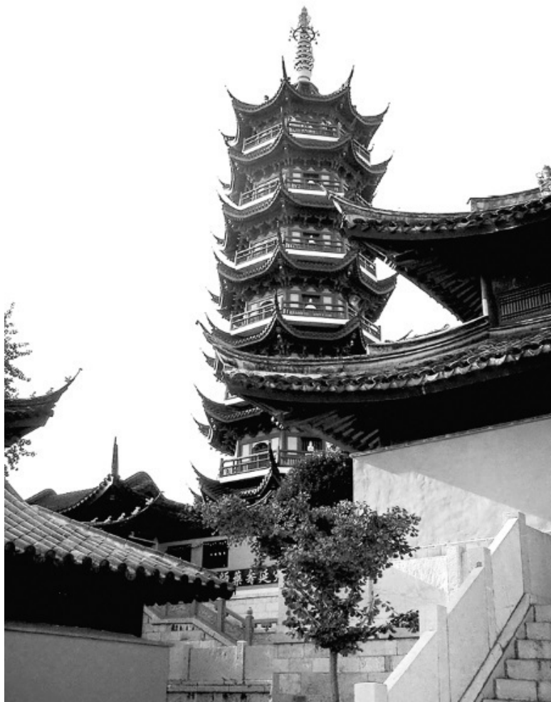
Храм Цзимин в Нанкине, в котором и расположен