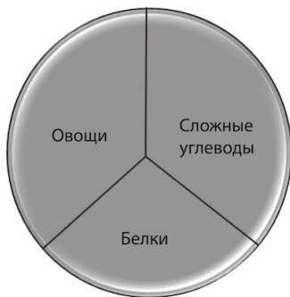
тарелка 1/3 для более плавного перехода

Сбалансированная тарелка делится на три части. Половину занимают овощи и фрукты, четверть – зерновые продукты и крупы, четверть – белковая пища. Я очень люблю эту тарелку, так как она предоставляет нам чёткую схему, которую мы можем изменять по своим потребностям и предпочтениям. Наличие выбора в определенных рамках чаще всего успокаивает нас и дает возможность сделать шаг вперед.