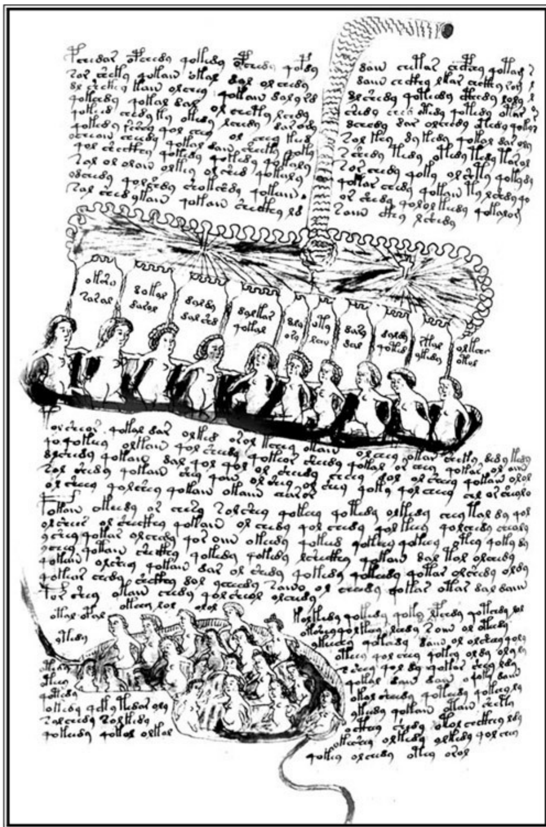
Лист из манускрипта Войнича