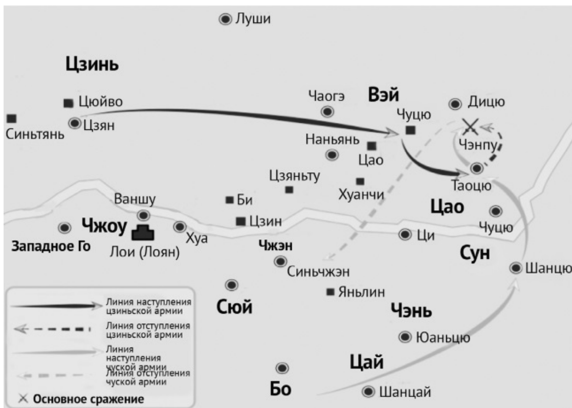
Стратегическая карта битвы при Чэнпу