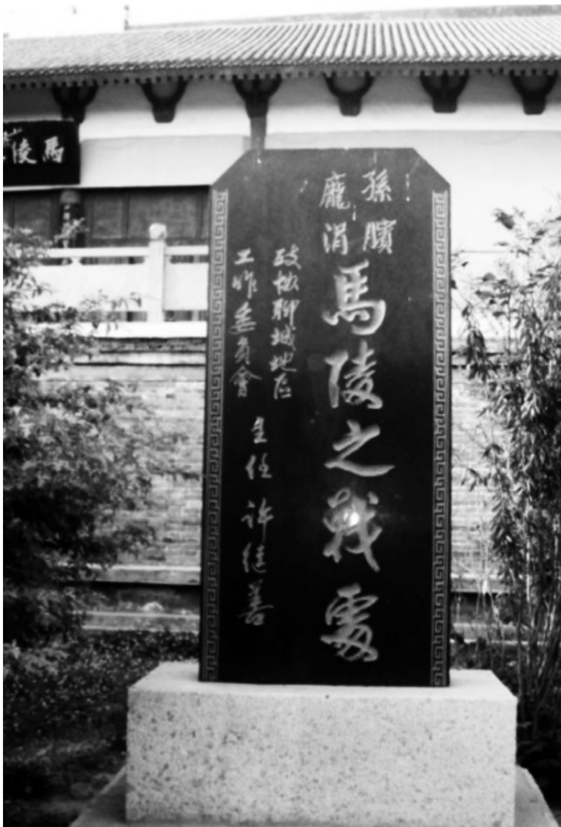
Памятник на месте битвы при Малиндао (деревня Малинцунь, провинция Шаньдун)

К вечеру в Малиндао прибыл Пан Цзюань. Разведка доложила ему, что дорога перекрыта деревьями, и командующий поспешил вперед, чтобы осмотреть завал. В сумерках он заметил надпись на дереве у дороги и приказал зажечь огонь. Рассмотрев письма, Пан Цзюань обо-