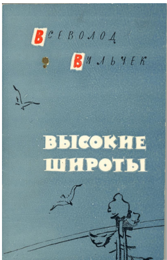
Обложка книги стихов, изданной в Красноярске в 1964 г.