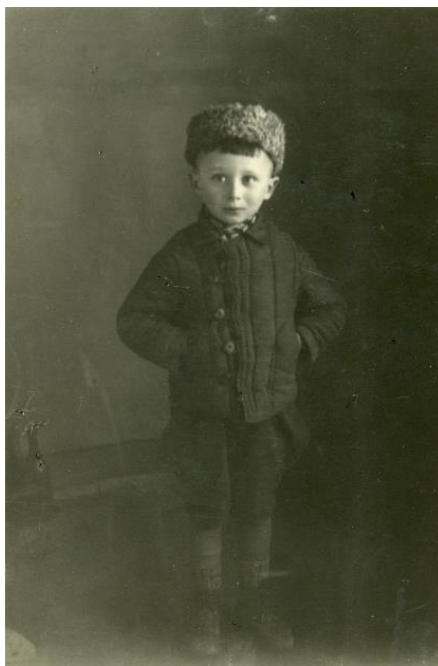
После эвакуации в Ташкент. Севе – 7 лет. 1944 г.