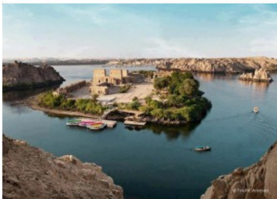
Остров Филе около первых порогов Нила.

Стремительный Голубой Нил берет своё начало из высокогорного эфиопского озера Тана, навстречу ему, через цепь великих озер и заболоченные равнины Центральной Африки, течет спокойный полноводный Белый Нил. Весной, когда в горах Эфиопии интенсивно тает снег, а в Тропической Африке в разгаре дождливый сезон, реки, питающие Нил, одновременно вбирают в себя громадное количество избыточной воды, несущей мельчайшие частицы размываемых горных пород и органические остатки буйной тропической растительности. В середине июля паводок достигает южных границ Египта. Поток воды, порой в десять раз превосходящий обычную норму, пробившись через горловину первых нильских порогов, постепенно затопляет весь Египет.