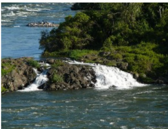
Начало Нила, Кампала, Уганда.

Границы собственно древнего Египта резко очерчены самой природой — – южным его пределом были труднопроходимые первые нильские пороги, находившиеся близ современного Асуана, в 1300 км от Средиземноморского побережья; – с запада к реке теснились песчаные уступы Ливийского плоскогорья; – с востока подступали безжизненные каменистые горные отроги.