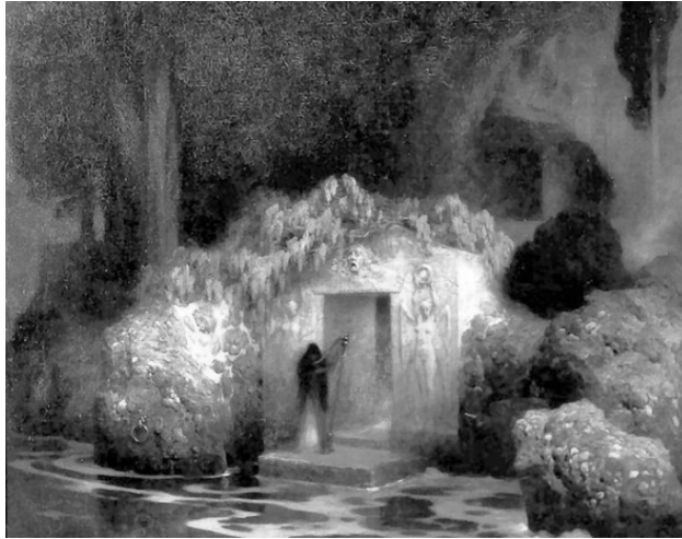
Фердинанд Келлер «Гробница Бёклина»

– Сто монет сейчас и двести по возвращению, – квестор поймал усмешку, тронувшую уголки губ наемника. – Мало? Мы не требуем многого, только найти и привести в монастырь.