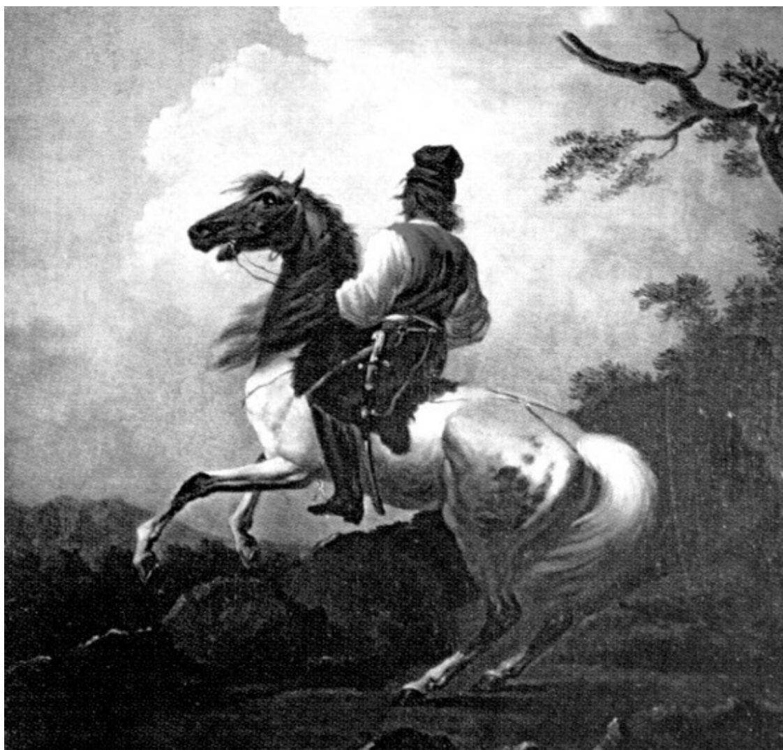
Александр Орловский «Всадник»

История с продолжением. Когда герой в конце книги не убит и не сыграл свадьбу с единственной, у читателя очень часто возникает законное желание узнать, а что же будет дальше с ним, полюбившимся персонажем. Продолжит он свои деяния или что-то встанет на его пути? Продлятся ли его странствия, а может, он все-таки осядет где-то, уйдя окончательно и бесповоротно на покой. Как тут не вспомнить знаменитую книгу Толкина «Хоббит» – о маленьком, но отважном и мужественном создании, отправившемся туда и обратно до пещеры с драконом. Нашедшего друзей, а еще – таинственный артефакт, кольцо, делающее его невидимым... ну как тут не написать продолжение? И тоже можно сказать о принцах Амбера, янтарного королевства, затерянного в странных временах, в невероятном сплетении технологий и магии. А что говорить о соперничавших кланах Семи королевств? Тем более, Джордж Мартин так и не развязал свой узел, и нам, читателям, остается только ждать и гадать, что же случится на самом деле, а не в посредственно отснятом и нелепо набросанном восьмом сезоне, столь поругаемом как критиками, так и зрителями.