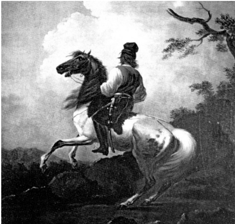
Александр Орловский «Всадник»

А потом, когда он допишет до означенной сериалом «Игра престолов» точки – не начнет ли вести новое продолжение? Или, по причине болезней и преклонного возраста, может, передаст хрупкую, филигранную работу своим подмастерьям.