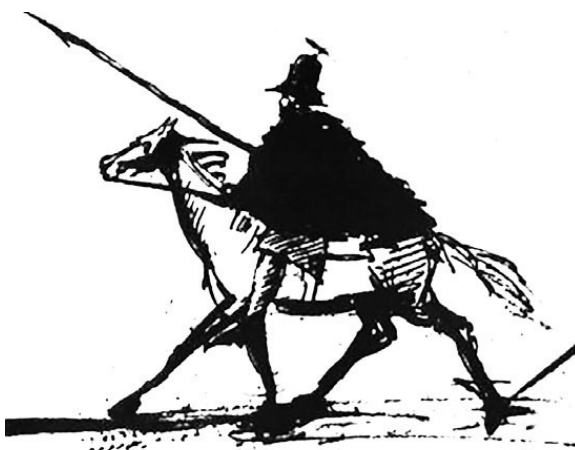
А.С. Пушкин. Автопортрет в бурке. 1829 год