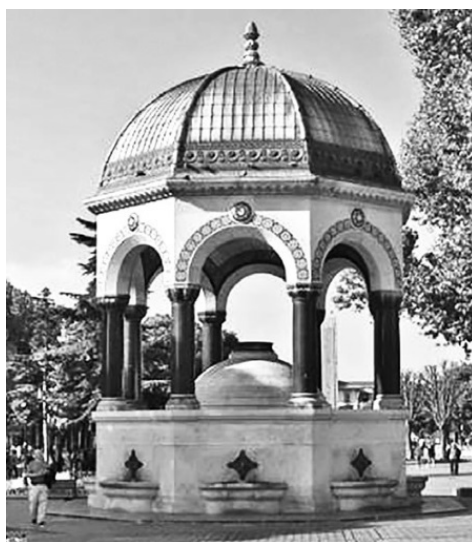
Немецкий фонтан, подарок кайзера

Жизнь султана была на волоске и только вмешательство германского императора Вильгельма II спасло ему жизнь. Посредством Энвер-бея, которого Вильгельм знал лично, комитет младотурок узнает, что Германия признает новый режим, если будет сохранена жизнь Абдул-Хамида.