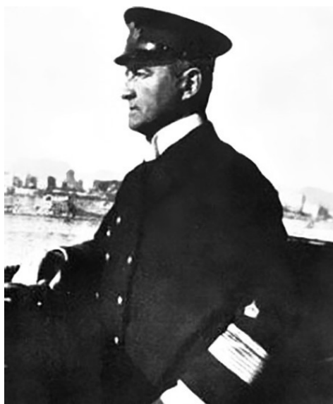
Командующий средиземноморской эскадрой контр – адмирал Вильгельм Сушон

Пополнение турецкого флота германскими кораблями придавало ему новые качества. Линейный корабль «Гебен» по размерам, скорости хода, вооружению и бронированию значительно превосходил любой русский линейный корабль. Боевая мощь его орудий приблизительно соответствовала суммарной силе трех лучших черноморских линейных кораблей. Десяти узловой перевес в скорости позволял немцам выбирать время и место боя. «Гебен» представлял смертельную угрозу русским крейсерам и большинству эскадренных миноносцев, которые из-за недостаточной скорости могли быть быстро уничтожены. Сравнительно слабый (двенадцать 105-мм орудий) «Бреслау» благодаря 27-узловому ходу являлся прекрасным дополнением к «Гебену» и пользовался полной свободой передвижения даже в условиях соприкосновения со всем Черноморским флотом. Несмотря на формальную передачу туркам и назначение вторых (турецких) командиров, «Гебен» и «Бреслау» полностью сохранили свои хорошо подготовленные экипажи, возглавляемые немецкими офицерами. Качественное превосходство этих кораблей над прочим составом турецкого флота делало их совершенно уникальным фактором в боевых действиях на море.