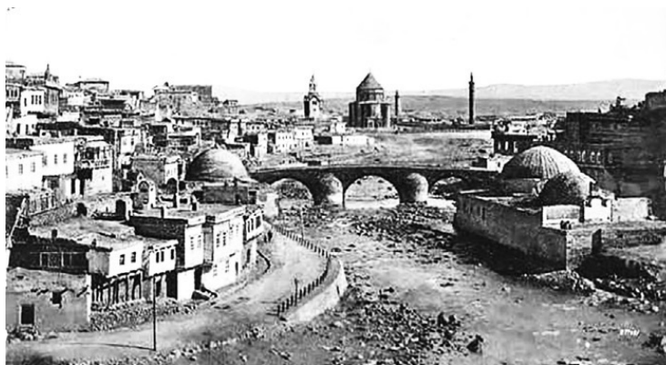
Город Карс в составе России. Каменный мост через Карс, 1902 год

За время нахождения в составе России экономическое развитие Карсской области заметно улучшилось. Сами турки отмечали, что царское правительство собирало с населения меньше налогов, чем османское, уважительно относилось к религии и обычаям местного населения. Царское правительство не призывало мусульман уезжать из Карсской области, но в то же время не препятствовало эмиграции. С 1879 по 1882 годы более 140 тысяч человек (4/5 всех мусульман) из Карсской и Батумской областей уехали в Османскую империю. Однако половина из них вернулась назад в свои дома, так как переживавшая экономический кризис Османская империя не могла выполнить свои обещания перед иммигрантами. Таким образом, накануне Первой мировой войны в 1914 года мусульмане составляли практически половину населения Карсской области и 90 % – Батумской. В отличие от Крыма и Северного Кавказа царской администрации не удалось успешно заселить Карскую область крестьянами из России. К 1914 г. всего 5 % постоянных жителей (не считая войска и официальных лиц) в Карсской области и менее 1 % в Батумской относились к этническим русским. В основном это были сектанты – молокане и духоборы. В то же время численность армянского населения увеличилась до 30 % по естественным причинам, а не вследствие царской политики. Также следует отметить, что благодаря нахождению в составе России армянам Карсской и Батумской области удалось избежать геноцида, устроенного османскими властями в 1915 году.