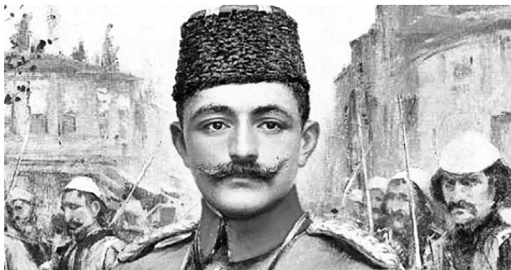
Энвер-бей в 1908 году в момент восстания против султана

Энвер-бей объявился во главе отряда из 200 бойцов и присоединился к коменданту города Ресны Ахмеду Ниязи-бею. Именно эти два офицера подняли восстание против султанского режима. Даже обещанные султаном суммы за головы Ниязи-бея и Энвер-бея, не нашли своих получателей. Популярность бунтовщиков возрастала. В ходе восстания на переднем плане оказалась личность Энвер-бея и, когда 23 июля 1908 года Энвер-бей провозгласил революцию, то это был поистине его звездный час. О простом майоре Энвер-бее как о борце с деспотическим правлением султана Абдул-Хамида узнали во всем мире. В тот же самый день два армейских корпуса, расположенные в Македонии, объявили о намерении двинуться на Константинополь, чтобы ввести в стране конституционное правление. До 1923 года Константинополь являлся столицей Османской империи. Только в 1930 году он был официально переименован в Стамбул, хотя со дня завоевания столицы Византии османы этот город именовался Istambul (дословно: «чтобы больше было мусульман»).