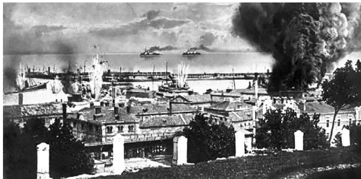
Нападение турецких миноносцев на Одессу 16 октября 1914 года

Но начиная с 16 октября 1914 года турецкие корабли без объявления войны обстреляли Севастополь и Одессу, а на следующий день – Новороссийск, так началась новая русско-турецкая война. Младотурки, пришедшие к власти, решили, что в будущее «великое турецкое государство» должны были войти Кавказ и Крым, Башкирия и Татария, Средняя Азия и т. д. Эта программа имела откровенно антирусскую направленность: именно Россию младотурки считали основным противником на пути осуществления своих захватнических целей. Именно тогда в конце октября 1914 года существовавший военный округ был преобразован в Русскую Кавказскую армию, которая включала в свой состав 1-й Кавказский, 2-й Туркестанский корпуса и отдельные соединения: 66-ю пехотную дивизию, две казачьи дивизии, две бригады и другие части. Общая численность Кавказской армии составляла 153 батальона, 175 казачьих сотен, 12 саперных рот, 350 полевых орудий и 5 батальонов крепостной артиллерии. Всего свыше 170 тысяч человек. Русская армия опиралась на крепости Карс и Батум.