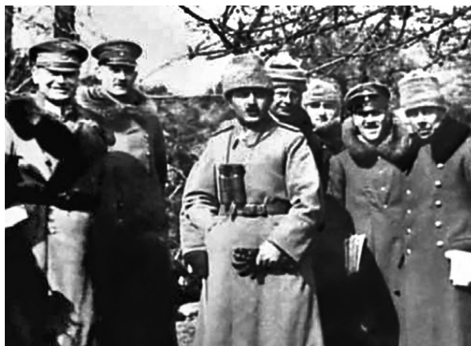
Энвер-паша с германскими офицерами на кавказском фронте

После разгрома русских войск Энвер-паша мечтал овладеть всем Закавказьем, поднять восстание всех мусульман России и объединить под скипетром турецкого султана все тюркские народности Прикаспия, Поволжья, Западной Сибири, Туркестана и Ирана. Свои планы Энвер-паша изложил командующему турецко-германской армией маршалу Лиману Отто фон Сандерсу, которые тот нашел фантастическими и курьезными.