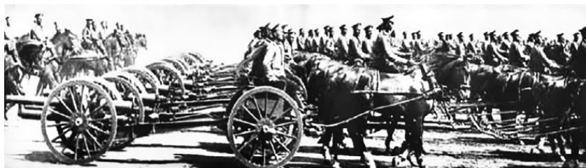
Русская артиллерия, 1914–1917 гг.

К началу боевых действий в России было заготовлено всего 7 млн 5 тысяч снарядов. Их запасы на складах закончились через 4–5 месяцев боевых действий в то время, как российская промышленность произвела за весь год могла покрыть потребности армии за один месяц. В течение 1915–1916 годов остроту снарядного кризиса удалось снизить благодаря увеличению собственного производства и импорту. За 1915 год Россия произвела 11 238 млн снарядов, и импортировала 1 317 млн. В начале 1916 года национализируются два крупнейших завода Петрограда – Путиловский и Обуховский. На начало 1917 года снарядный кризис был полностью преодолен, и артиллерия располагала даже чрезмерным количеством снарядов. Теперь приходилось три тысячи снарядов на легкое орудие и 3 500 на тяжелое, при одной тысячи в начале войны.