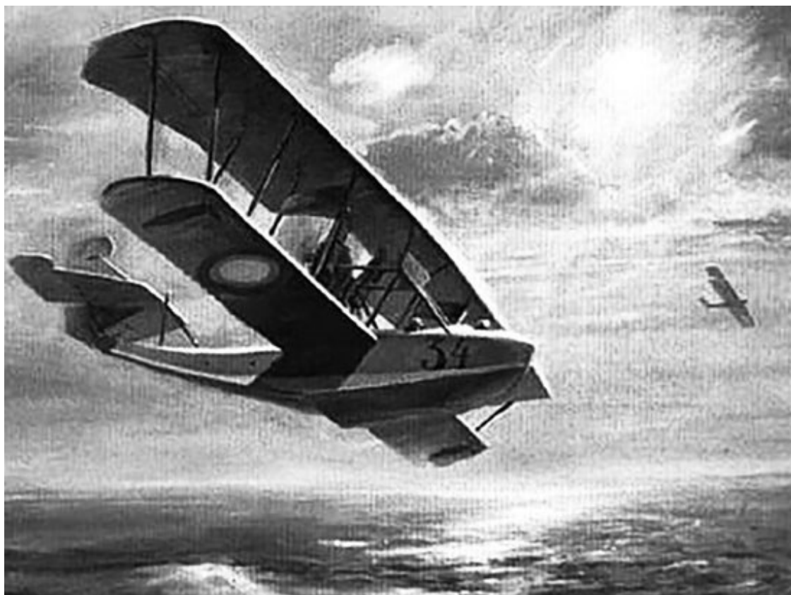
Первый крупносерийный русский гидросамолет Григоровича

В 1911 году был учрежден Императорский военно-воздушный флот. К началу войны Россия имела больше всех аэропланов – 263, у Германии – 232, у Франции – 156, у Англии – 90, у Австро-Венгрии – 65. Россия была мировым лидером в области строительства и применения гидросамолетов, разработанных Д.П. Григоровичем. В морском министерстве к 1 августа 1914 года насчитывалось более трех десятков самолетов различных типов и около 20 дипломированных летчиков. Причем офицеры проходили летную подготовку непосредственно на флотах.