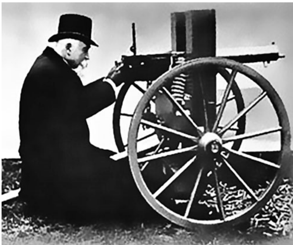
Хайрем Максим со своим пулеметом, 1883 год

На момент окончания мобилизации в 1914 году в армии насчитывалось всего 4,6 млн винтовок при численности самой армии в 5,3 млн. Потребности фронта составили 100–150 тысяч винтовок ежемесячно при производстве на 1914 год только 27 тысяч. Положение удалось исправить благодаря мобилизации гражданских предприятий и импорту. На вооружение поступали модернизированные пулеметы системы Максима и винтовки Мосина образца 1910 года, новые орудия калибров 76 —152 мм, автоматы Федорова. Винтовку производили на Тульском, Ижевском и Сестрорецком оружейных заводах и заказывали за границей – во Франции, США. В мае 1895 года указом императора был принят на вооружение русской армии револьвер Нагана под 7,62-мм патрон. К моменту начала войны армия была полностью обеспечена револьверами.