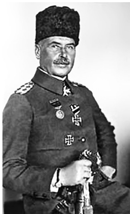
Турецкий маршал, немецкий генерал, командующий турецко-германской армией Лиман Отто фон Сандерс (1855–1929)

К лету 1914 года роль немецких военных в турецкой армии и на военно-морском флоте было существенным и составляло 800 офицеров и 25 тысяч солдат. То же самое относится и к роли немцев во время депортации и уничтожения армянского меньшинства в Османской империи.