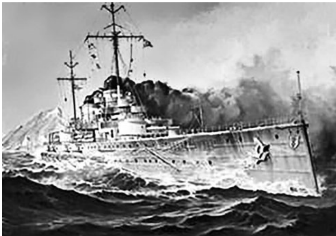
Немецкий крейсер «Гебен»

К началу столетия турецкие военно-морские силы представляли собой сборище морально и технически устаревших кораблей. У турок было всего два бронепалубных крейсера «Меджидие» (построен в США 1903 г.) и «Гамидие» (Англия 1904 г.), два эскадренных броненосца «Тортуг Рейс» и «Хайреддин Барбаросса» закупленные в Германии, четыре построенных во Франции эскадренных миноносца, а также четыре эсминца немецкой постройки. При этом турецкие морские силы не имели какой-либо боевой подготовки. Только 10 августа 1914 года приход из Средиземного моря двух новейших немецких крейсеров: тяжелого «Гебена» (названного «Султан Селим») и легкого «Бреслау» («Мидилл») позволил Турции вести боевые действия в бассейне Черного моря. Командиром Средиземноморской дивизии был назначен контр-адмирал Сушон. Крейсер «Гебен» был мощнее любого русского линкора старого типа, но при их столкновении всегда уходил, пользуясь своей высокой скоростью.