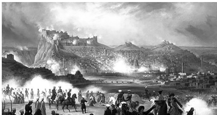
Взятие крепости Карс русской армией

6 ноября 1877 года ровно 141 год назад русская армия штурмом взяла турецкую крепость Карс. Тем самым русские войска открыли дорогу на Эрзерум – главный оплот Турецкой империи на Кавказе. Долгие годы цитадель Карс была сильнейшей на восточных рубежах Османской империи. Англичане называли его турецким Гибралтаром. В крепости находилось 151 орудие разного калибра, гарнизон составлял из 3 тысяч конницы, 4 тысяч пехоты и около 4 тысяч вооруженных местных жителей. Русская армия в XIX в. четырежды брала эти ворота на Кавказ и Закавказье – в 1807, 1828, 1855 и 1877 годах. В Крымской (Восточной) войне 1853–1856 гг. Карская крепость по итогам мирных переговоров на Парижском конгрессе была обменена на морскую крепость Севастополь, оккупированный союзными войсками. Такова была цена Карса. Это была стратегическая крепость 10 октября русские войска окружили Карс и начали осадные работы. Крепость лежала на реке Карс-чай и прикрывала путь с севера на Эрзерум. Местность была пересеченная, с большим количеством высот. На восточном берегу реки к Карсу подходили Карадагские высоты, а на западном имелись две группы высот – Шорахская и Чахмахская. На восток и юг тянулась холмистая равнина и была наиболее доступна для штурма. Главными в системе обороны были форты и укрепления, прикрывавшие крепость со всех сторон. Протяженность линии обороны достигала 20 км. На северо-востоке находилась карадагская группа укреплений, самая сильная, состоявшая из фортов, Араб-табия и Карадаг, башни Зиарет.