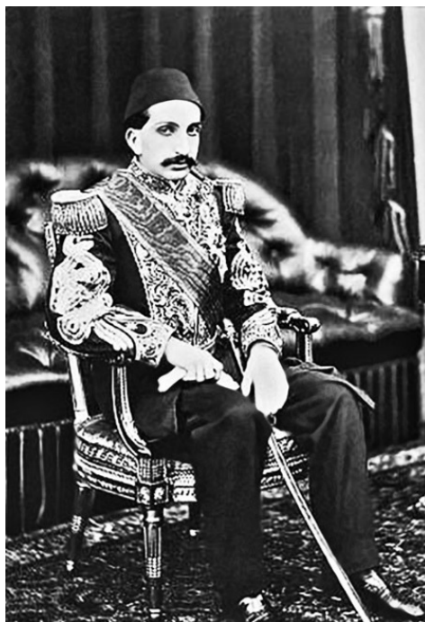
Султан Абдул-Хамид II правил с 1876 по 1909 годы

Жизнь султана была на волоске и только вмешательство германского императора Вильгельма II спасло ему жизнь. Посредством Энвер-бея, которого Вильгельм знал лично, комитет младотурок узнает, что Германия признает новый режим, если будет сохранена жизнь Абдул-Хамида.