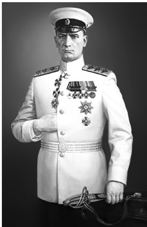
Вице-адмирал А.В. Колчак – командующий Черноморским флотом

Лишь в конце XX века в развитие Черноморского флота были вложены значительные средства. К октябрю 1917 года южный флот, несмотря на понесенные в ходе Первой мировой войны потери, представлял серьезную боевую силу, вполне сравнимую с мощностью сильнейших флотов Средиземноморского бассейна – французского, итальянского. В состав российского флота на Черном море вошли два новых линейных корабля-дредноута, семь линейных кораблей додредноутного типа, три крейсера, двадцать три эскадренных миноносца, пятнадцать подводных лодок, три авиатранспорта, многочисленные малые корабли и катера. На верфях Николаева строились: линейный корабль, четыре легких крейсера, четыре эскадренных миноносца, десять подводных лодок и другие корабли.