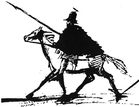
А.С. Пушкин. Автопортрет в бурке. 1829 год

вой цепи казаков. Можно поверить, что донские казаки были чрезвычайно изумлены, увидев перед собою незнакомого героя в круглой шляпе и в бурке.