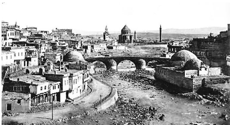
Город Карс в составе России. Каменный мост через Карс, 1902 год

ну населения Карсской области и 90 % – Батумской. В отличие от Крыма и Северного Кавказа царской администрации не удалось успешно заселить Карсскую область крестьянами из России. К 1914 г. всего 5 % постоянных жителей (не считая войска и официальных лиц) в Карсской области и менее 1 % в Батумской относились к этническим русским. В основном это были сектанты – молокане и духоборы. В то же время численность армянского населения увеличилась до 30 % по естественным причинам, а не вследствие царской политики. Также следует отметить, что благодаря нахождению в составе России армянам Карсской и Батумской области удалось избежать геноцида, устроенного османскими властями в 1915 году.