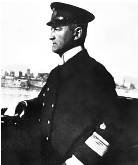
Командующий средиземноморской эскадрой контр – адмирал Вильгельм Сушон

Запоздалый выход в море главных сил Черноморского флота, предпринятый его командующим А.А. Эбергардтом 16 октября, естественно, окончился безрезультатно. Быстроходный противник не стал дожидаться возмездия. После поиска «Гебена» флот возвратился в Севастополь 19 ноября на следующий день после официального объявления Россией войны Турции. Очередной поход российского флота состоялся в период с 22 по 25 октября с целью обстрела угольного порта Зунгулдак и минирования подходов к Босфору. Во