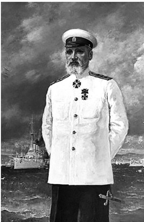
Командующий Черноморским флотом до июля 1916 года адмирал А.А. Эбергард

Его флагманский линкор «Евстафий» признан самым результативным судном Черноморского флота за Первую мировую войну. Ему принадлежит тот «золотой выстрел», который прозвучал после 12 часов 18 ноября 1914 года, когда эскадра Черноморского флота приближалась к южной око-