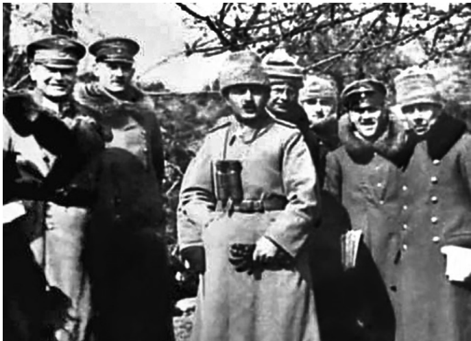
Энвер-паша с германскими офицерами на кавказском фронте

Спустя пять лет после прихода младотурецкой партии к власти Османская империя находилась в состоянии серьезного экономического и внутривластного кризиса. 85 % 22-ти миллионного населения страны было занято в сельском хозяйстве. В слабо развитой промышленности и транспортной инфраструктуре господствовал иностранный капитал, ориентированный на военные нужды. В империи функционировал один артиллерийский завод и единственная снарядно-патронная фабрика. Предприятия химической промышленности отсутствовали вовсе. Общая протяженность