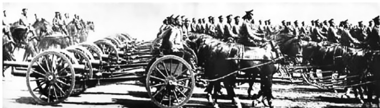
Русская артиллерия, 1914–1917 гг.

К началу боевых действий в России было заготовлено всего 7 млн 5 тысяч снарядов. Их запасы на складах закончились через 4–5 месяцев боевых действий в то время, как российская промышленность произвела за весь год могла покрыть потребности армии за один месяц. В течение 1915–1916 годов остроту снарядного кризиса удалось снизить благодаря увеличению собственного производства и импорту. За 1915 год Россия произвела 11 238 млн снарядов, и импортировала 1 317 млн. В начале 1916 года национализируются два крупнейших завода Петрограда – Путиловский и Обуховский. На начало 1917 года снарядный кризис был полностью преодолен, и артиллерия располагала даже чрезмерным количеством снарядов. Теперь приходилось три тысячи снарядов на легкое орудие и 3 500 на тяжелое, при одной тысяче в начале войны.