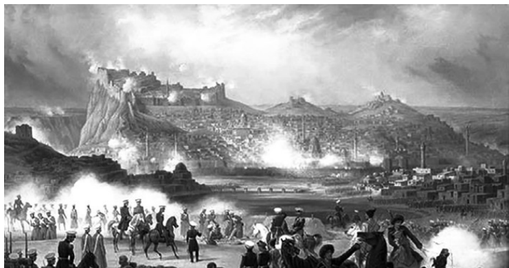
Взятие крепости Карс русской армией

ла цена Карса. Это была стратегическая крепость 10 октября русские войска окружили Карс и начали осадные работы. Крепость лежала на реке Карс-чай и прикрывала путь с севера на Эрзерум. Местность была пересеченная, с большим количеством высот. На восточном берегу реки к Карсу подходили Карадагские высоты, а на западном имелись две группы высот – Шорахская и Чахмахская. На восток и юг тянулась холмистая равнина и была наиболее доступна для штурма. Главными в системе обороны были форты и укрепления, прикрывавшие крепость со всех сторон. Протяженность линии обороны достигала 20 км. На северо-востоке находилась карадагская группа укреплений, самая сильная, состоявшая из фортов, Араб-табия и Карадаг, башни Зиарет.