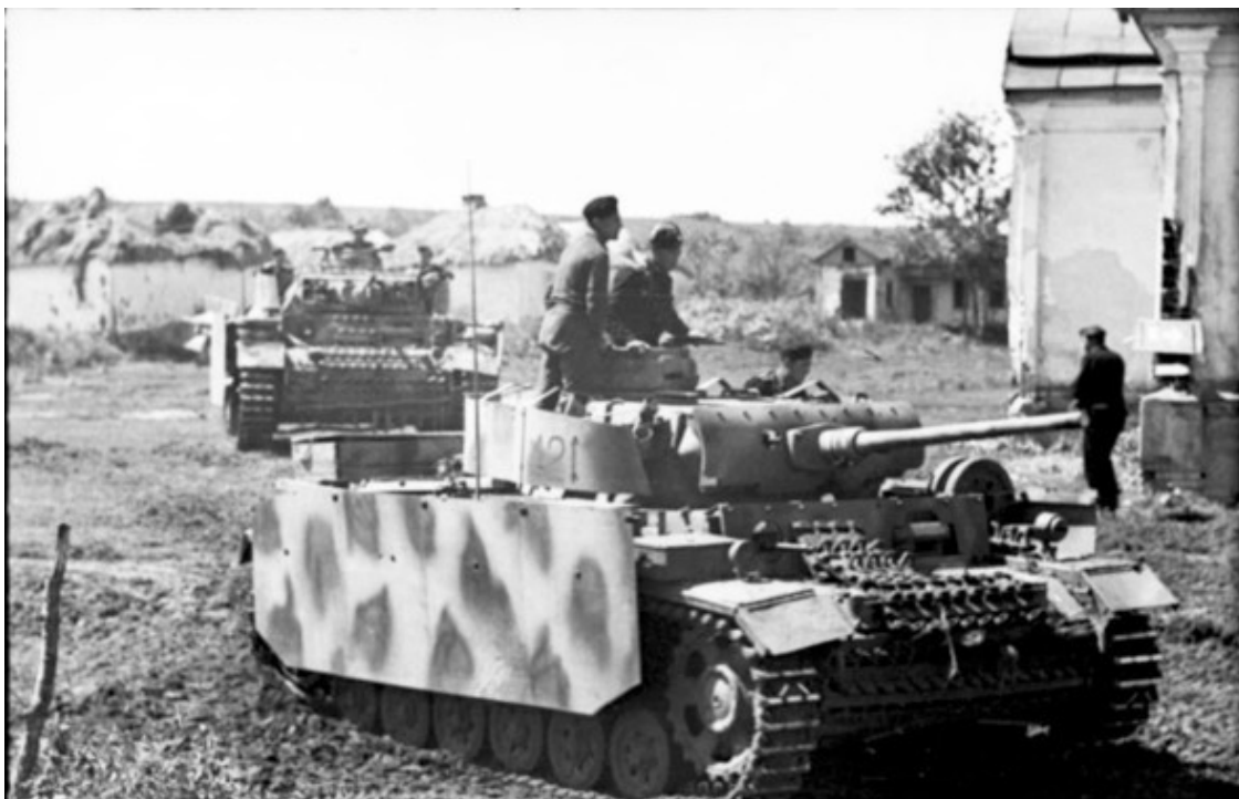
1943 Juni - Juli