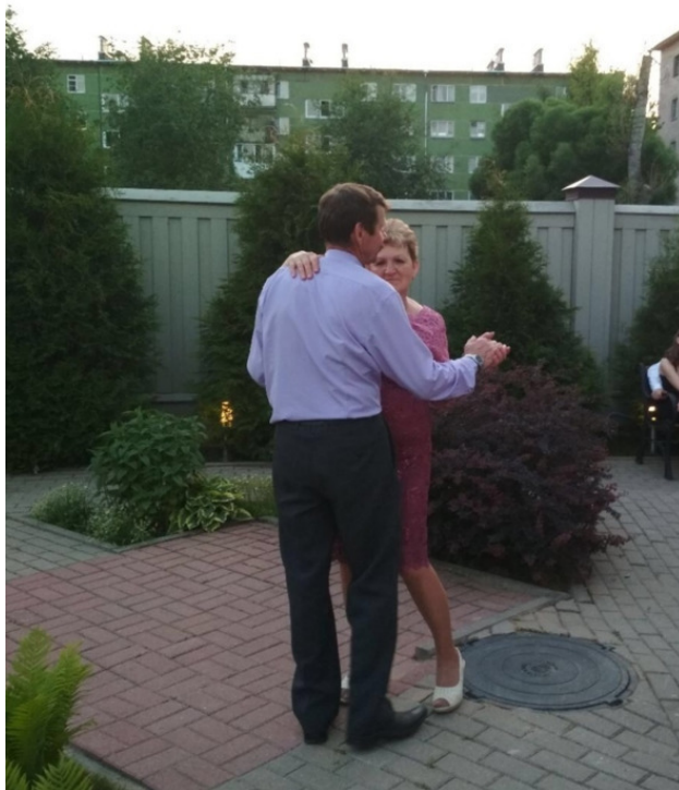
д. Галунинская, Вожегодский р- н, Вологодская область.