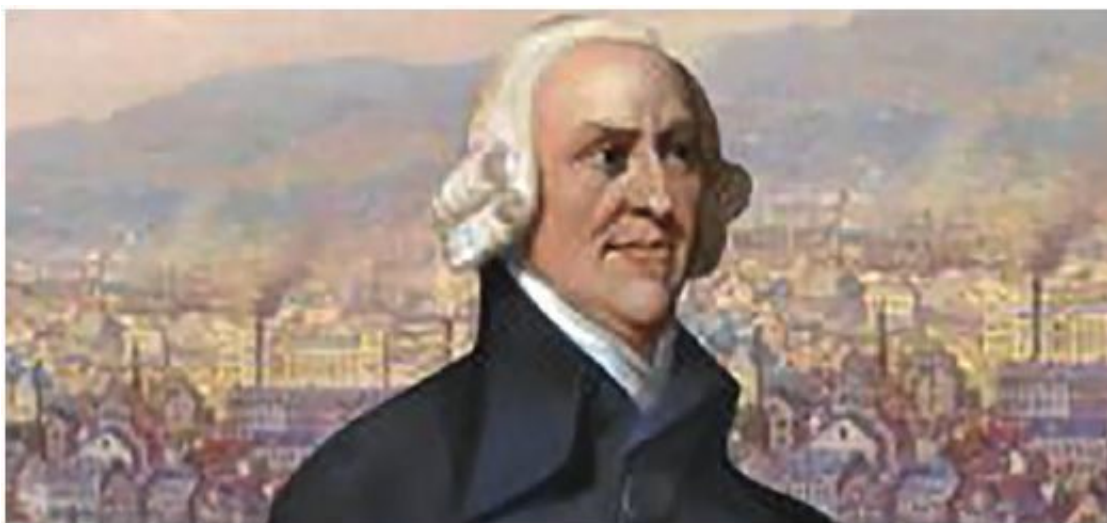
Адам Смит (1723–1790)

Тем не менее авторы данной монографии рассматривают категорию рынка в качестве морального императива. И небезосновательно. Поскольку «невидимая рука» рынка, о которой писал Адам Смит – основоположник рыночной теории (будучи моральным философом), есть не что иное, как «невидимая рука» Провидения, а именно «невидимая рука» Господа Бога.