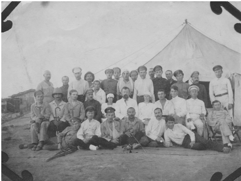
Госпиталь лагеря Сиди-Бишир, 1920–1921 г.