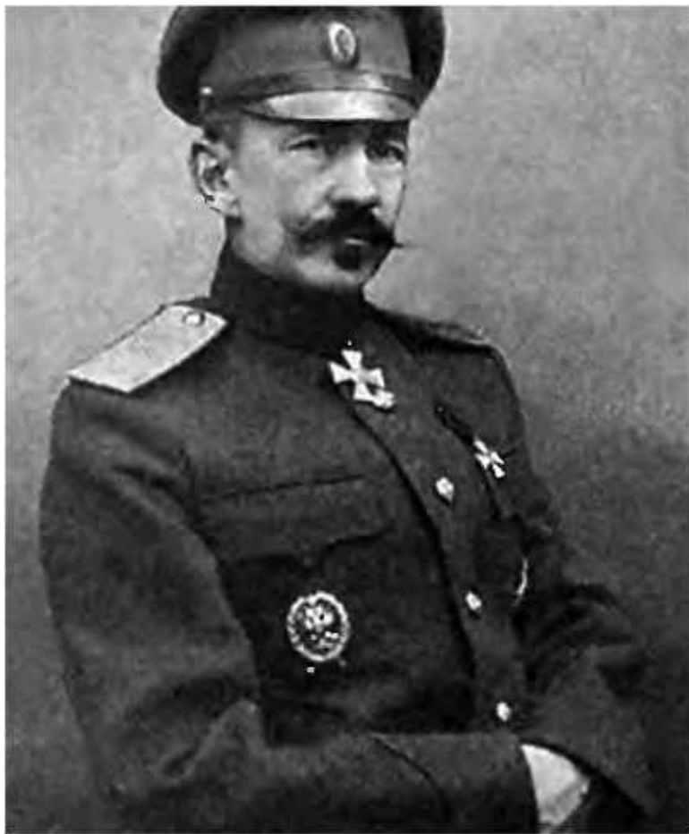
Генерал от кавалерии В. И. Гурко (Ромейко-Гурко) – с 14. 08. 1916. командовал Особой армией, 31. 03. – 22. 05. 1917.