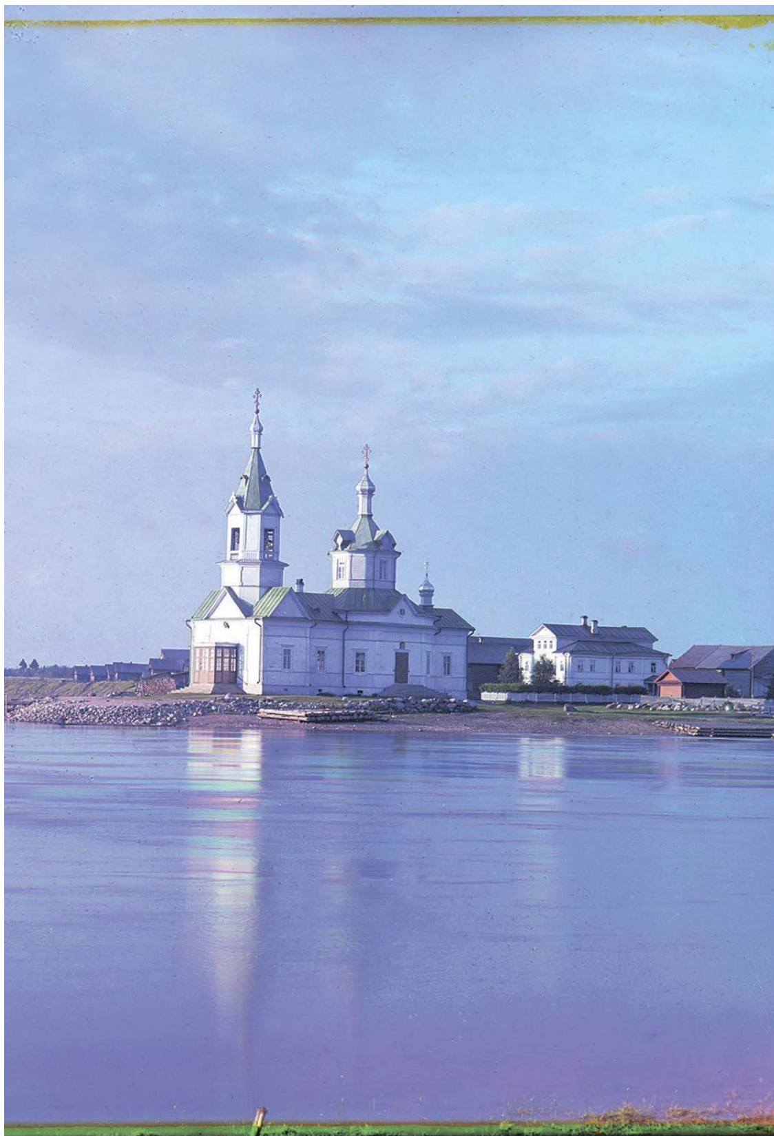
Река Вазинка и село Важино [Богоявленская церковь в деревне Усть-Боярской, Важины.] Олонецкая губерния. 1909 г. 1