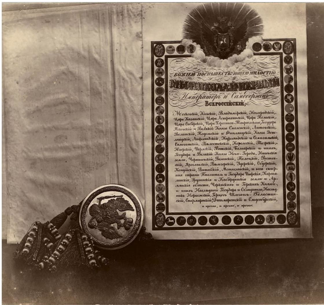
Грамота, пожалованная жителям села Коробово императором Николаем I. Костромская губерния. 1911 г.