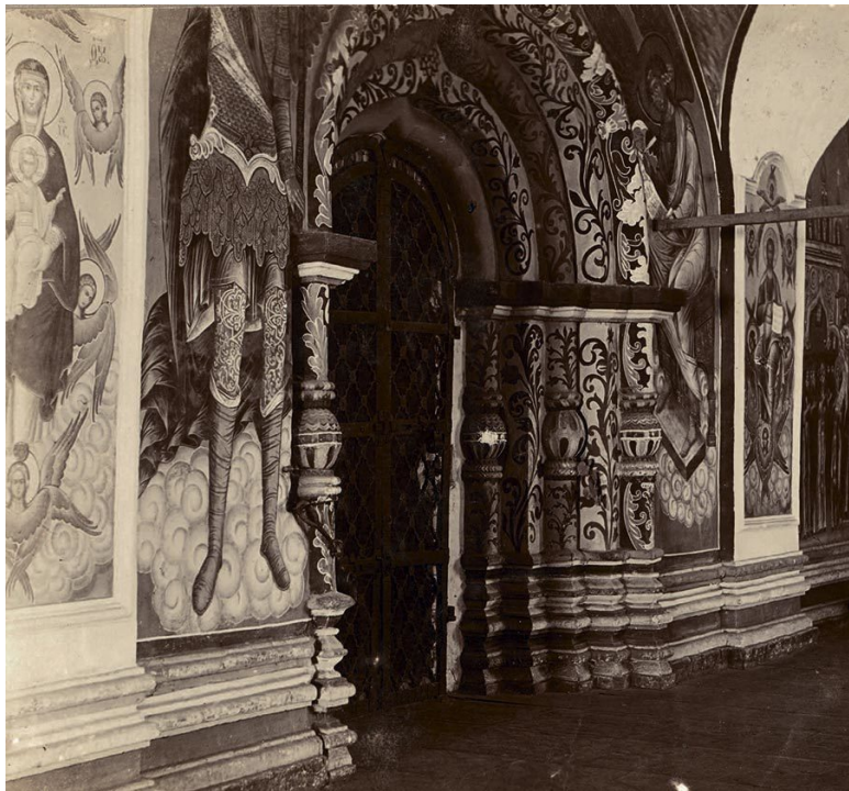
Вход из западной галереи в Троицкий собор в Ипатьевском монастыре. Кострома. 1910 г.