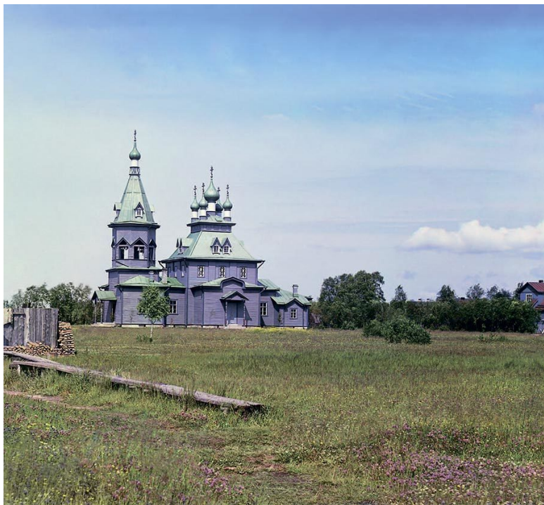
Никольская церковь в Лаврово. Санкт-Петербургская губерния. 1909 г.

Оставленная на произвол судьбы, бывшая каменная твердыня через несколько десятилетий, пожалуй, совсем распадется, оставив по себе лишь смутную память в потомстве».