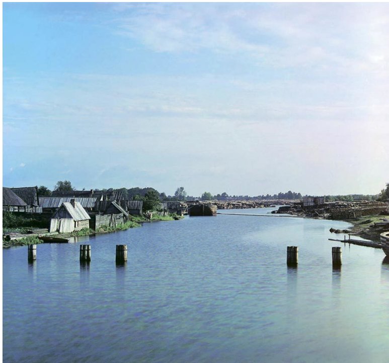
Вид на реку Назия от канала императора Петра I. Деревня Нижняя Назия. Санкт-Петербургская губерния. 1909 г.