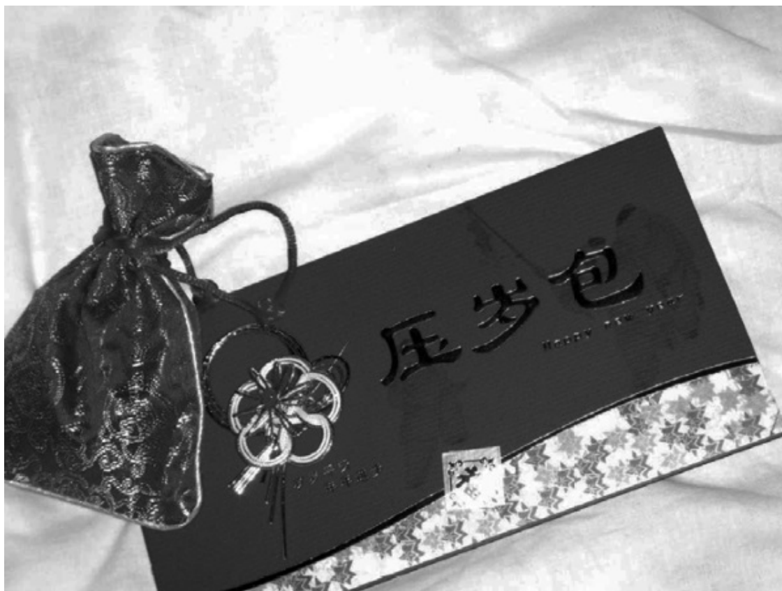
Праздничные конверты с деньгами

Итак, вечером в канун Нового года все взрослые дарят детям ясуйцянь. Их еще называют «го Нянь цянь» («деньги празднования Нового года»). В древности ясуйцянь представляли собой сто нанизанных на красную нитку медных монет, символизирующих сто лет жизни. А сейчас это бумажные купюры, упакованные в красный бумажный конверт. Поэтому их стали называть «хунбао» («красный конверт»). Количество купюр в конверте обязательно должно быть четным: это символизирует гармонию и удачу.