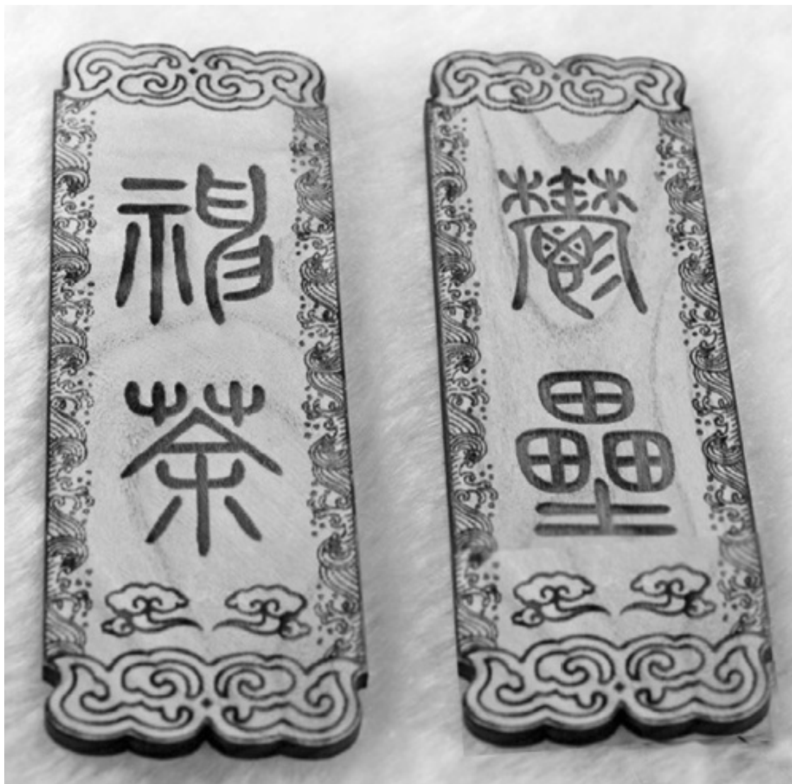
Персиковые дощечки «таофу» с вырезанными на них именами Шэнь Шу и Юй Люя

Люди в округе узнали, что братья уничтожили Е Ванцзы, и с тех пор питали к ним огромную благодарность. Они почитали Шэнь Шу и Юй Люя как своих благодетелей и спасителей.