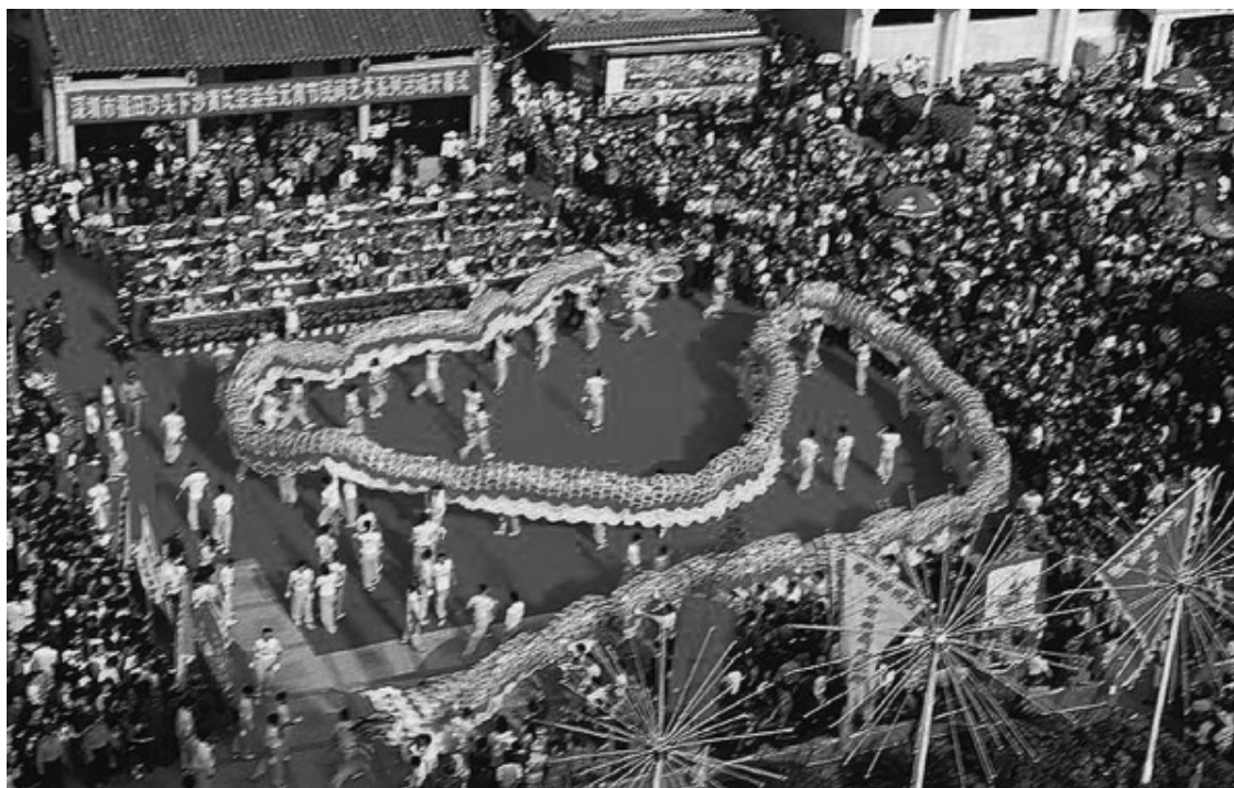
Новый год все смотрят танец дракона с фонарями

В древних китайских легендах дракон выступает покровителем рек, озер и морей, божеством дождя для сельского хозяйства, и его могущество безгранично. Поэтому танец дракона – это не просто развлечение. Он значит крайне много, так как играет роль молитвы о богатом урожае. Посредством танца дракона просили, чтобы в новом году погода была благоприятной для возделывания земли, урожай – богатым, а люди всей страны – жили в мире. Танец дракона пользуется популярностью, поэтому где бы ни оказалась труппа, исполняющая его, она всегда получит теплый прием. Артисты часто за день исполняют этот танец на пяти-шести торжествах подряд (такие торжества называются «лунхуан-цзю»). Когда танец дракона заканчивается, декоративные голову и хвост сжигают, а тело оставляют, чтобы использовать на следующий год.