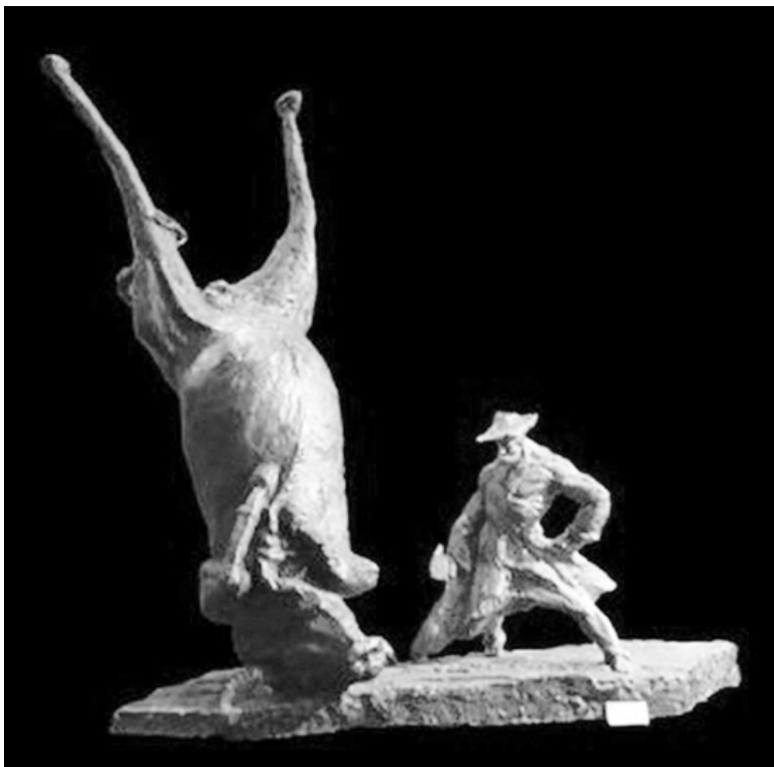
Скульптура «Повар Дин разделявает коровью тушу»

Повар Дин подал Хуэй-вану только что протертый нож.