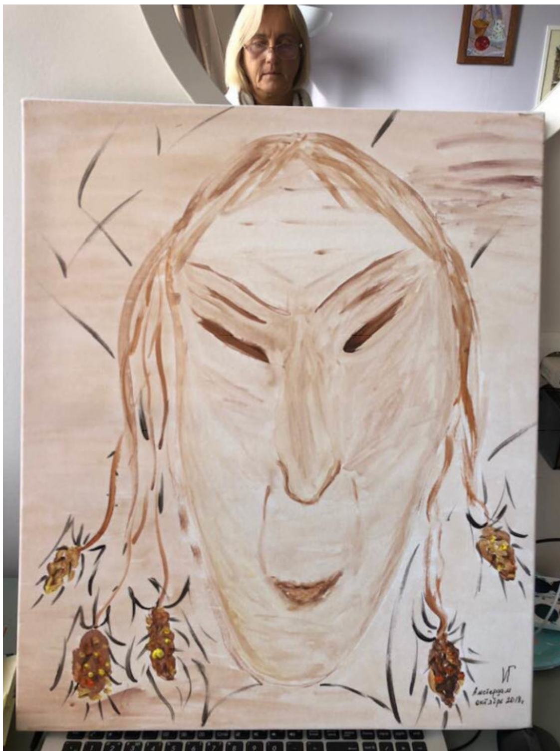
Автопортрет в стиле сибуми