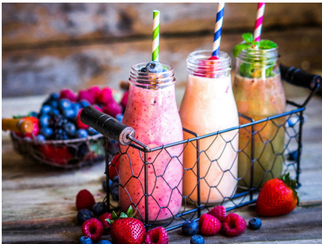
Жидкая пища – это ключ к стройности и новому телу

И подробнее о жидкой еде: если в меню содержится пункт «питьевая форма», например, в графе «ужин», то это означает, что прием пищи должен основываться на однородном, растертом, измельченном и прочем подобном питании. Нельзя жевать, задействовать челюсти, не допускаются комочки. Однако это вовсе не означает, что нужно непосредственно пить. Ты не должна питаться на ужин одной водой и чаем, даже если он «питьевой».