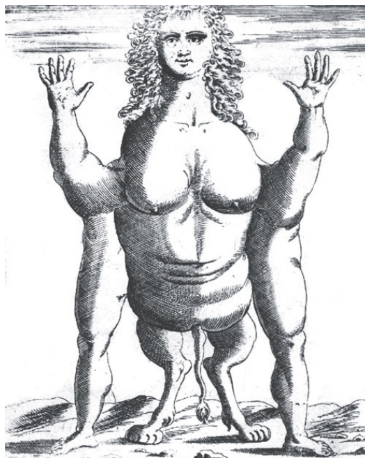
Al mare m. d. d. e. u. g. f. e. l. e. u. a. n. t. e. s. e. t. r. o. u. a. n. o. s. i. m. i. l. e. s. o. r. t. e. d. e. f. e. m. i. n. e. l. e. q. u. e. s. o. n. o. m. o. l. t. o. g. r. a. n. d. i. s. i. m. i. l. e. e. l. c. o. l. l. o. l. e. g. h. o. f. u. o. r. a. d. i. n. a. t. u. r. a. l. e. b. r. a. z. z. e. s. p. o. n. t. a. n. t. e. c. o. l. l. o. g. a. b. e. e. t. n. e. l. l. e. p. a. r. t. e. d. i. d. r. i. t. t. o. h. a. n. n. o. d. e. c. a. m. b. e. a. s. s. i. m. i. l. e. a. d. d. u. e. p. i. e. d. i. f. o. r. m. a. n. t. e. c. o. l. l. o. d. e. a. s. s. i. m. i. l. e. a. l. t. e. a. n. i. m. a. l. i. e. b. e. s. t. i. a. d. e. s. t. e. p. e. r. t. e. q. u. a. r. t. o. s. t. a. t. o. l. i. i. n. o. p. o. t. r. a. d. e. l. i. q. u. a. l. i. d. u. e. s. e. a. l. l. e. u. a. n. o. e. d. u. e. n. e. a. m. a. r. g. o. e. s. o. n. o. t. a. t. e. a. s. i. n. d. e. l. e. q. u. a. l. e. f. a. n. n. o. f. o. r. m. a. z. z. o. p. e. r. l. o. r. u. i. u. r. e. l. i. s. u. a. m. m. a. i. s. c. h. i. s. o. n. o. s. i. m. i. l. e. a. e. s. t. e. s. u. l. u. a. n. o. n. h. a. n. n. o. s. i. g. r. a. n. c. o. r. p. o. e. t. e. t. e.