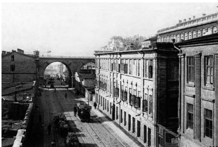
Карантин. Балка Деволан

Наша книга позитивная, но некоторые печальные страницы истории Одессы обойти никак нельзя. Одесса – портовый город, и поэтому неоднократно страдал от эпидемий холеры и чумы, которые следовали за вспышками этих заболеваний на Ближнем Востоке. Были две эпидемии в 1797 и 1803 годах, но самая страшная эпидемия случилась в Одессе в 1812 году. Еще продолжалось нашествие Наполеона, а в Одессе в августе начали умирать люди. Поначалу боялись произнести это страшное слово, но потом доктора были вынуждены признать: «чума». Ришелье действовал решительно: город был разделен на пять частей. Был учрежден карантин.