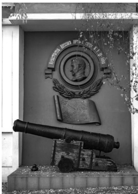
Барельеф Деволану и пушка

Деволан – брабантский (голландский) дворянин, родился в Антверпене, успел пожить и поучиться в Америке, а в возрасте 35 лет попал на русскую службу. Вот такие кульбиты были вполне обычными в 18 веке: из США ехали к нам. Деволан поработал в Николаеве, а также поучаствовал во всех сражениях русско-турецкой войны, в том числе в штурме Измаильской крепости, за что был награжден орденами Святого Георгия и Святого Владимира. Но помимо храбрости Деволан обладал гениальным талантом инженера, проектировщика и архитектора, который сполна проявился при создании плана Одессы. Ведь именно Деволан придумал наш город таким, как он есть. С широкими параллельными улицами, начинающимися от моря. Марк Твен, приезжавший в Одессу в середине XIX-го столетия, обратил внимание, что город похож на американский. Не в Америке ли подсмотрел Деволан, как нужно строить города?