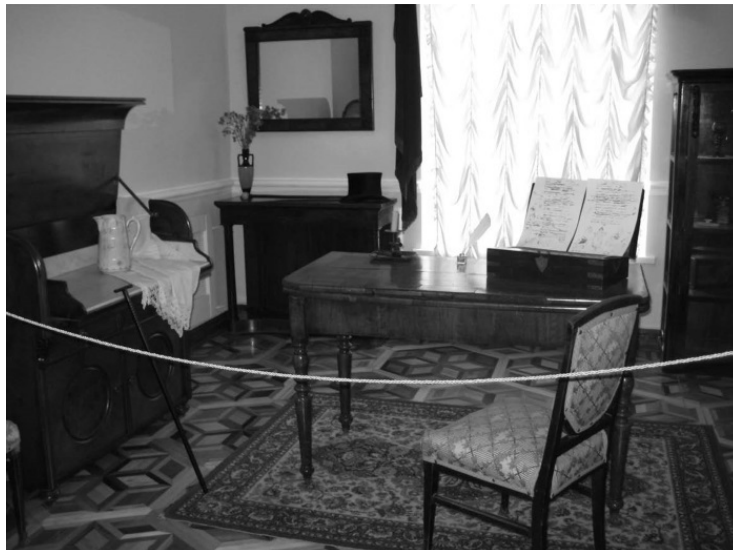
Комната Пушкина в Одесском музее Пушкина

И невзгоды одесской жизни Пушкин не забыл упомянуть. Рассказывают, что в Одессе иногда бывало так грязно, что некоторые улицы просто на ночь закрывали на цепь (например, улицу Почтовую, ныне Жуковского) для предотвращения исчезновения людей в грязевой пасти.