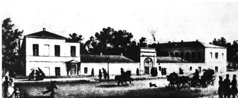
Ришельевский лицей почти двести лет назад

Пришлось городу при Дюке и пережить нелегкие испытания во время нашествия Наполеона на Российскую империю и последовавшей чумы. Несмотря на тяжелые потери, город выстоял и продолжал развиваться. Одесситы так любили герцога, что говорят, провожать его вышло десять тысяч человек, что невероятно, если учесть, что в городе тогда жило около тридцати тысяч жителей. Столько людей не выходило на улицы даже в самые горячие дни, когда город был уже миллионником. Герцог бы и не уехал никуда, но в его родной Франции происходили исторические события, снова восстановилась монархия, а герцог все-таки был заядлым роялистом. И как он не любил Одессу, но отбыл из нее в 1814 году навсегда. При этом, как свидетельствуют современники, у многих одесситов были слезы на глазах, что еще более невероятно и говорит об особой сентиментальности того времени. На моей памяти градоначальников провожали только с радостью и ухмылками.