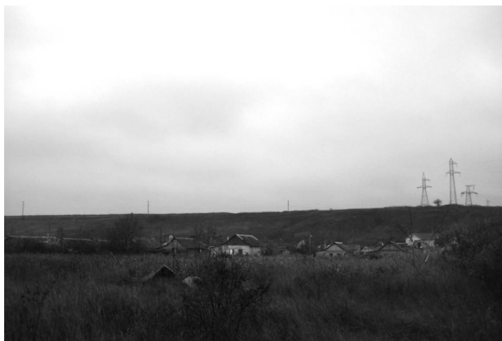
Жевахова гора. Для одесситов она родная