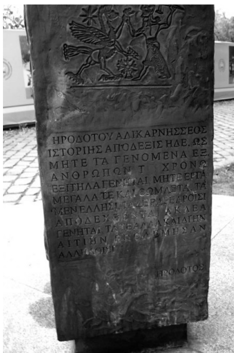
Памятный столб в честь греческого прошлого Одессы

Благодатную землю с хорошим климатом у моря заприметили еще древние народы. Нельзя не вспомнить трипольскую культуру, которая существовала в V–IV тысячелетии до нашей эры и является важным этапом древней истории современной Украины. Самой близкой к современной Одессе была так называемая усатовская культура, небольшая по ареалу, зато основательная. На территории села Усатово, а это практически Одесса, найдены остатки древнего поселения. Жили пращуры неплохо: ловили рыбу, охотились на кабанов, оленей, зайцев и пр. Нужно отметить, что в ту пору Хаджибеевский лиман был пресноводной рекой, впадавшей в море, и никакой Пересыпи еще не было. Одесситы любят хвастаться своим генеалогическим древом, подтверждающим, насколько глубоко они пустили корни в Одессе. Один говорит, что он одессит в четвертом поколении, другой – что в седьмом, а я знаю человека, который утверждает, что он потомок «усатовцев», при этом у него такая убедительная интонация и такой суровый взгляд, что поневоле в это веришь. Вообще, всегда, во всем нужно верить одесситу, чтобы он там ни говорил.