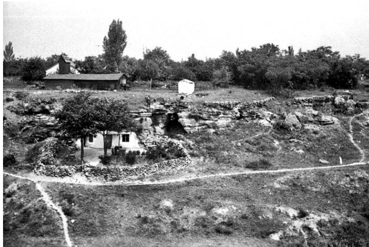
Что осталось от древних жилищ

Район Шкодовой горы точно не является престижным. Это Пересыпь, здесь заливает иногда, сюда ходит из транспорта только «камышовый» трамвай. На самой Шкодовой горе расположен нефтеперерабатывающий завод, который иногда дымит трубами. Частный сектор здесь разношерстный: хорошие дома, возле которых припаркованы джипы, соседствуют с развалюхами. Хотя, с другой стороны, здесь близко к центру, и очень красивый вид на поля орошения, лиман и море вдали.