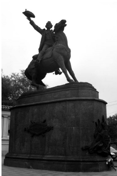
Памятник Суворову в Одессе

Поскольку все это известно, я напишу философскую заметку. О том, что не надо судить людей восемнадцатого века по меркам двадцать первого. И людей шестнадцатого века не нужно судить по меркам третьего тысячелетия. Российская империя и ее государи действовали по тогдашним правилам игры. Сильный побеждает, слабый проигрывает. Всего было пятнадцать русско-турецких войн, непосредственно к завоеванию Северного Причерноморья привели две из них (еще война 1768–1774 годов). До прихода Российской империи здесь была историческая область Едисанская орда. Екатерина предписала «ордынцам» переселиться в Зауралье. Было восстание, но Суворов его жестоко подавил.