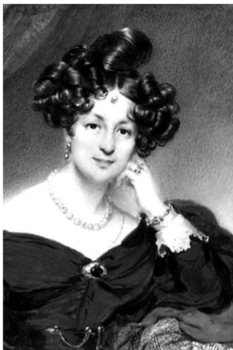
Елизавета Воронцова. Миниатюра М. Даффингера 1835 г.

Воронцов был просвещенным человеком, он понимал необходимость отмены крепостного права, был против телесных наказаний, и много помогал простым солдатам и простому люду. Известны факты, когда он за свои деньги лечил раненых, а также оплачивал долги офицеров и солдат, для чего ему пришлось даже продать одно имение.