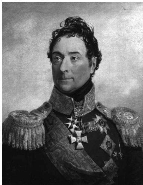
Граф Александр Федорович Ланжерон. Портрет Д. Доу 1825 г

Это Дерибас, Деволан, герцог Ришелье и граф Ланжерон. О чем думают, что замышляют четыре блестящих дворянина и офицера, когда вот так встречаются вместе? Это Дерибас на самом деле впервые пошутил над рассеянным Ланжероном, когда тот повернулся посмотреть на воду Дуная, желтая она или все-таки голубая. Дерибас произнес ставшее впоследствии знаменитым: «У Вас, сударь, вся спина белая». Деволан и герцог Ришелье зашлись от хохота, глядя на то, как Ланжерон пытается взглянуть на свою спину.