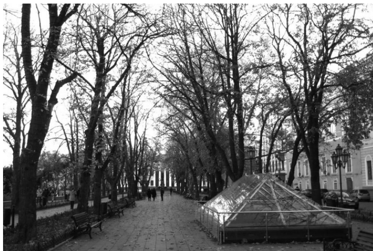
Под куполом – древнегреческая кладка, найденная в 2008 году