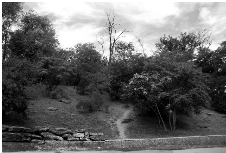
У подножия Чумки

Хоронили умерших в братской могиле, которая находится под всем известной в Одессе горой Чумка. Из опасения новой вспышки болезни была насыпана эта гора. Здесь категорически запрещено строительство, хотя сама Чумка не пустовала – на ней много лет расположена автобаза скорой помощи, которая и сейчас там. Чуть что – медики рядом.