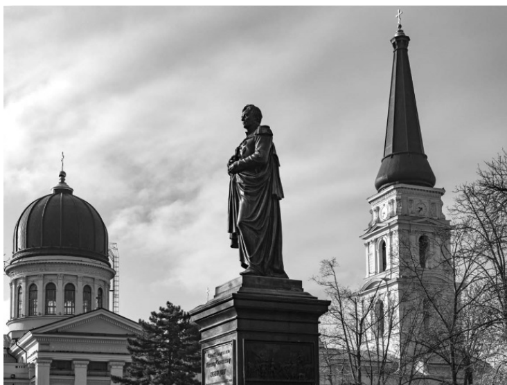
Памятник Воронцову на Соборной площади

В 1822 году Ланжерон ушел в отставку и в Одессу впервые прислали губернатора-русского – графа Михаила Семеновича Воронцова, которому было суждено править в Одессе двадцать один год – до 1844 года. Таким образом, лишь пятый правитель Одессы был «местным». Поговаривают, что от «европейцев» решили избавиться из-за того, что жизнь в городе была слишком вольной, что не соответствовало авторитарному духу Российской империи. Хотя нельзя сказать про Воронцова, что он был «неевропейцем», так как детство и молодость провел в Лондоне, где служил по дипломатической части его отец.