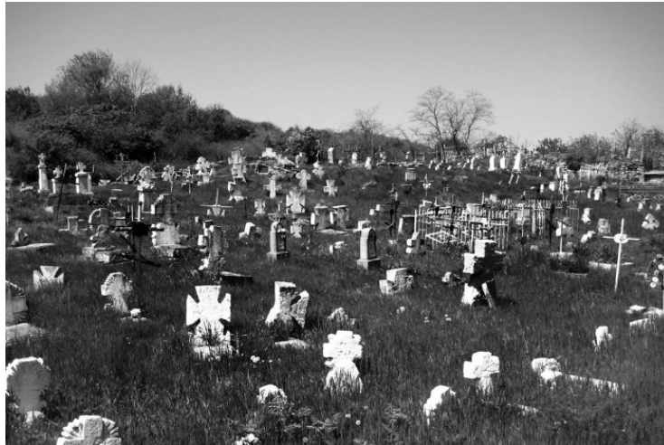
Казацкое кладбище у Шкодовой Горы

Сегодня Пересыпь не самый лучший район. Чего только стоят так называемые «поля орошения», – заболоченная местность, поросшая камышом, предназначенная для фильтрации сточных вод. Вид на нее красивый, но это издалека. Лучше всего на нее смотреть из иллюминатора самолета. А вблизи радости мало. Но никто не будет со мной спорить, что у Пересыпи – блестящие перспективы. Когда-то в светлом будущем здесь снова будет парк, причем ландшафтный, здесь будут аттракционы, всякие технопарки-припарки, огромная набережная с пальмами и кипарисами, может даже концертный зал построят на берегу моря. И будет здесь такая красота, что даже Сиднею не снилось.