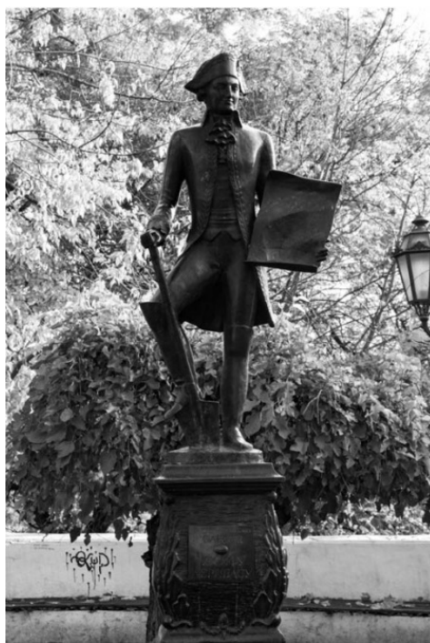
Памятник Де Рибасу в Одессе на Дерибасовской улице. Скульптор А. Князик, архитектор В. Глазырин

И кроме военных подвигов, суждено было Дерибасу сделать главное дело своей жизни – стать первым градоначальником Одессы. Хоть и побыл он на этом посту недолго, но именно под его надзором в Одессе закладывались первые камни и строились первые сооружения будущего порта и города. Дерибасу удалось также остаться при дворе и после смерти Екатерины