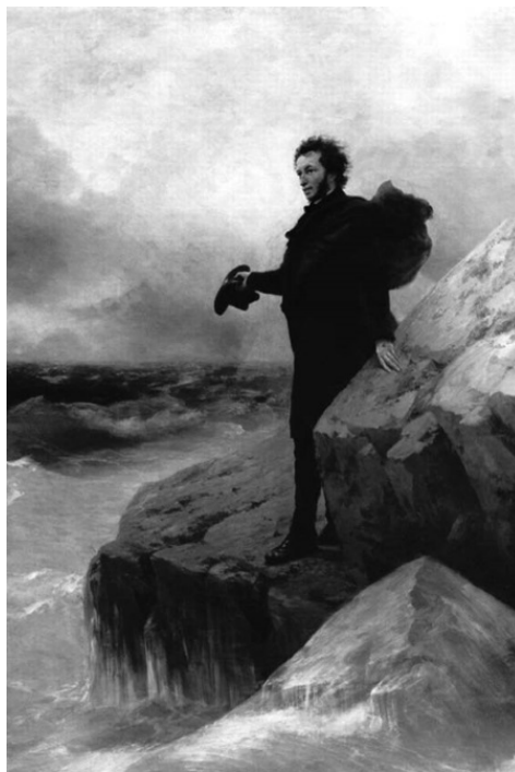
«Прощание Пушкина с морем»

Ришельевский лицей до 1857 года размещался в зданиях, которые сохранились на Дерибасовской и Екатерининской. В 1857 году он переехал на Дворянскую, где сейчас и находится основной корпус знаменитого Одесского университета. Но это совсем другая история.