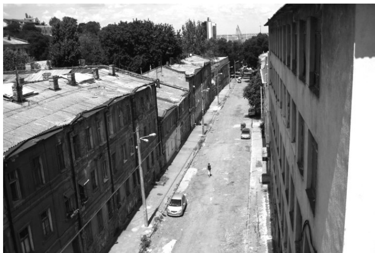
Деволановский спуск сегодня