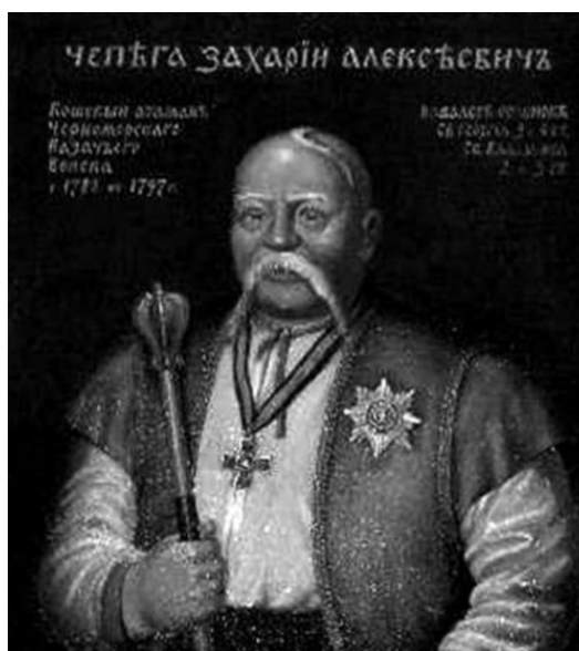
Атаман Захарий Чепига

Наиболее выдающимися казацкими лидерами были Антон Андреевич Головатый и Захарий Алексеевич Чепига.