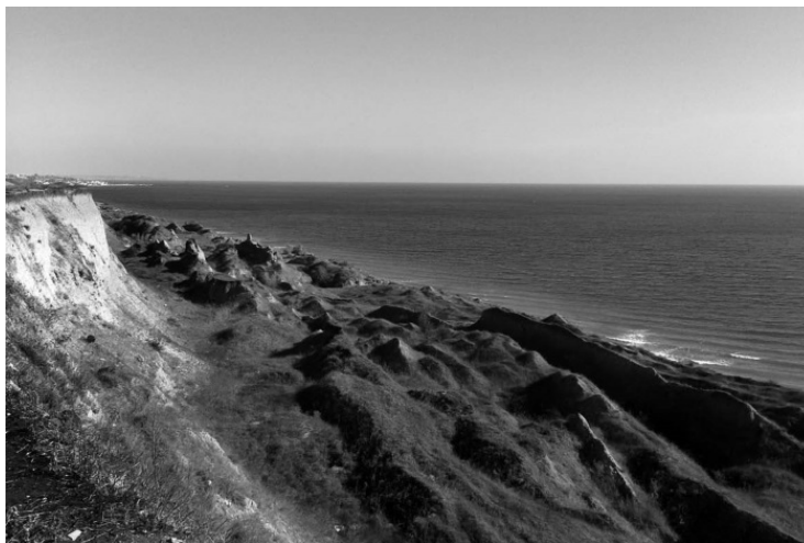
Таким был берег Одессы в доисторические времена. Подлинное фото

Березань, Никоний, который был расположен на другой стороне Днестровского лимана, аккурат возле нынешнего села Роксоланы. А ближе к нам, в Лузановке, была древнегреческая колония Истра (гавань Истриан). Греки у нас занимались тем же, чем везде занимаются греки: пили разбавленное вино, делали амфоры, торговали всем подряд со всеми, развивали искусство. Точно неизвестно, продавали ли они шубы, хотя есть серьезные историки, для которых сей факт является неоспоримым.