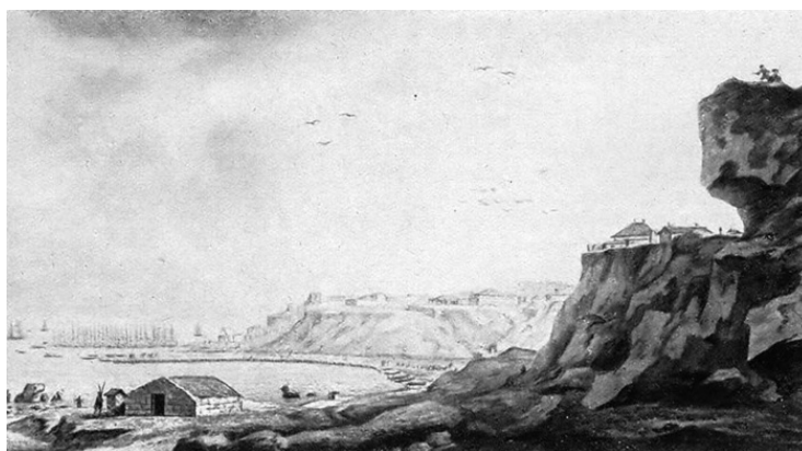
Когда Одесса была еще в пленках

Есть другая версия, очень веселая. При выборе места для основания города было много споров, хватит ли новому городу воды, так как до ближайшей реки Днестра 40 верст. По-французски «воды достаточно» звучит как assez d'eau (ассе до). А когда выяснилось, что с водой в Одессе действительно есть проблема, какой-то остряк прочитал эту фразу наоборот. Версию эту, скорее всего, сочинили гораздо позже основания Одессы, но важно отметить, что написание на латинице с двумя буквами S появилось неспроста. Во французском языке (и в немецком, кстати, тоже), который, как мы уже знаем, был распространен тогда при дворе, буква « S » между гласными читается, как « З ». И с одной буквой s Одесса читалась бы как «одеза». А вот две буквы ss читаются как « с ». Поэтому, правильное написание на латинице имени нашего города с двумя « ss » – Odessa .