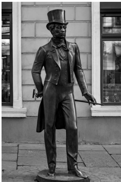
Памятник Пушкину на Пушкинской улице возле музея. Скульптор А. Токарев, архитектор В. Глазырин

И невзгоды одесской жизни Пушкин не забыл упомянуть. Рассказывают, что в Одессе иногда бывало так грязно, что некоторые улицы просто на ночь закрывали на цепь (например, улицу Почтовую, ныне Жуковского) для предотвращения исчезновения людей в грязевой пасти.