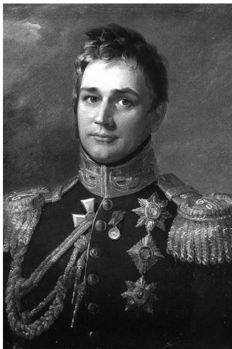
Граф Михаил Семенович Воронцов. Портрет Д. Доу