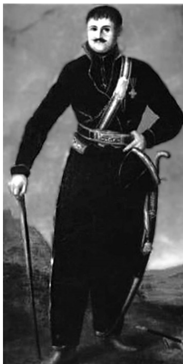
Казацкий атаман Антон Головатый

Как бы то ни было, 27 мая 1794 последовал Указ Императрицы, что именно на месте Хаджибея нужно основать «военную гавань купно с купеческой пристанью». Руководство строительством было возложено на Дерибаса. Надзор осуществлял Суворов. А план города составил талантливый инженер Деволан.