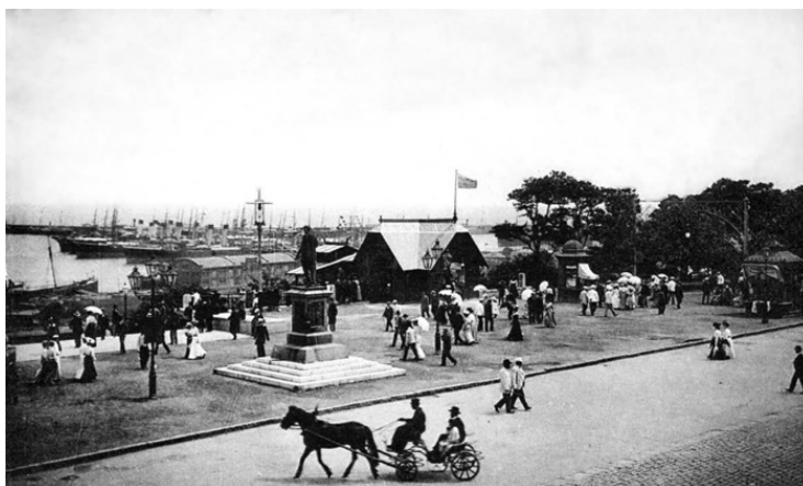
Сцена из прошлого «Возле Дюка»

Дюк де Ришелье был очень популярен у одесситов, которые сильно расстроились, когда он в 1814 году отбыл во Францию, чтобы принять участие в реставрации Бурбонов. Уже после смерти герцога в 1828 году в Одессе на Приморском бульваре был установлен прекрасный памятник работы петербургского скульптора Ивана Мартоса. С этим памятником связаны некоторые легенды. Некоторые одесситы советуют «смотреть на Дюка со второго люка». Я сколько ни смотрю, не вижу ничего такого, что я не видел в жизни. Но это так, мелочь, главная легенда – почему Дюк стоит на этом месте, и почему он каменный. Говорят, что однажды он вышел на бульвар, увидел, сколько к нему приехало родственников, и «окаменел».