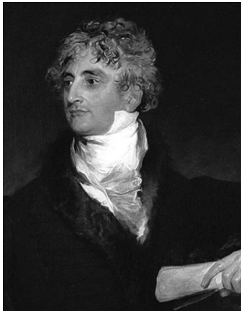
Арман Эммануэль дю Плесси Ришелье. Портрет Т. Лоуренса