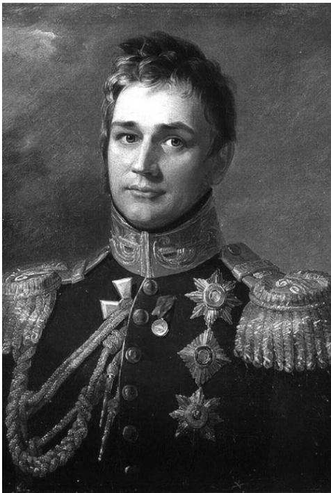
Граф Михаил Семенович Воронцов. Портрет Д. Доу