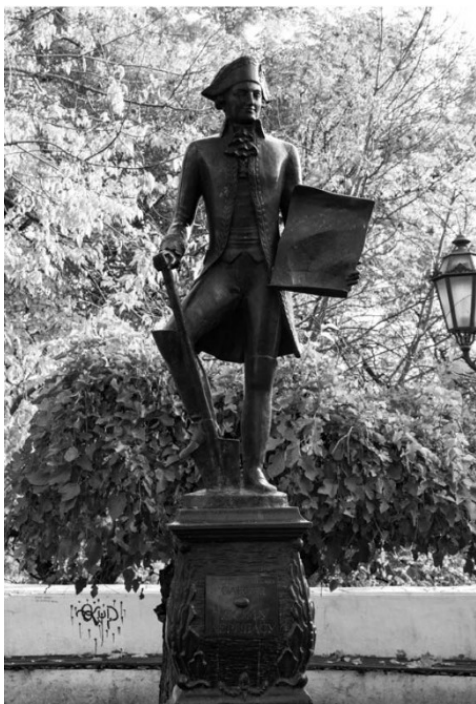
Памятник Де Рибасу в Одессе на Дерибасовской улице.

со стороны Дуная, в котором было много украинских казаков и который был прообразом морской пехоты). А Суворов появился под стенами Измаила всего за неделю до штурма, и ему пришлось просто утвердить план сражения, предложенный Дерибасом. Не верите? А современные историки говорят, что было именно так.