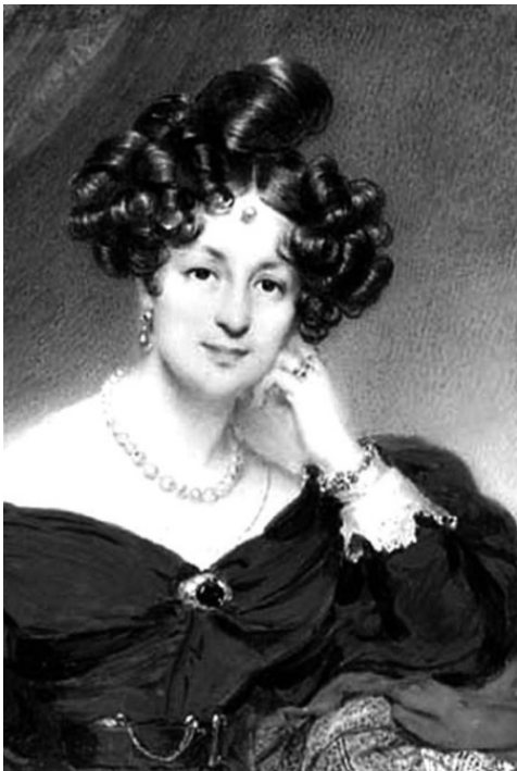
Елизавета Воронцова. Миниатюра М. Даффингера 1835 г.

Воронцов был просвещенным человеком, он понимал необходимость отмены крепостного права, был против телесных наказаний, и много помогал простым солдатам и простому люду. Известны факты, когда он за свои деньги лечил раненых, а также оплачивал долги офицеров и солдат, для