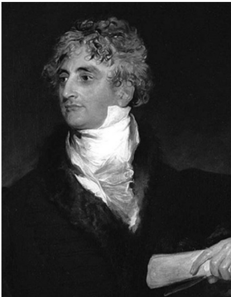
Арман Эммануэль дю Плесси Ришелье. Портрет Т. Лоуренса