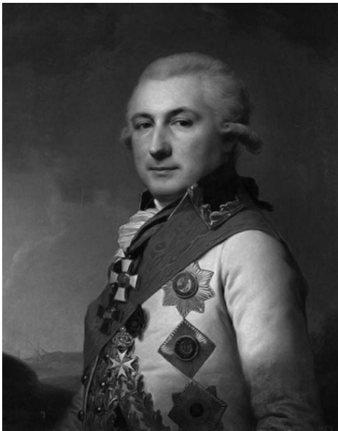
Портрет Де Рибаса. Художник И. Б. Лампи-старший 1796 г.