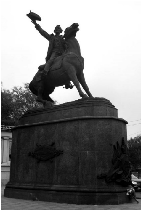
Памятник Суворову в Одессе

еванию Северного Причерноморья привели две из них (еще война 1768–1774 годов). До прихода Российской империи здесь была историческая область Едисанская орда. Екатерина на предписала «ордынцам» переселиться в Зауралье. Было восстание, но Суворов его жестоко подавил.