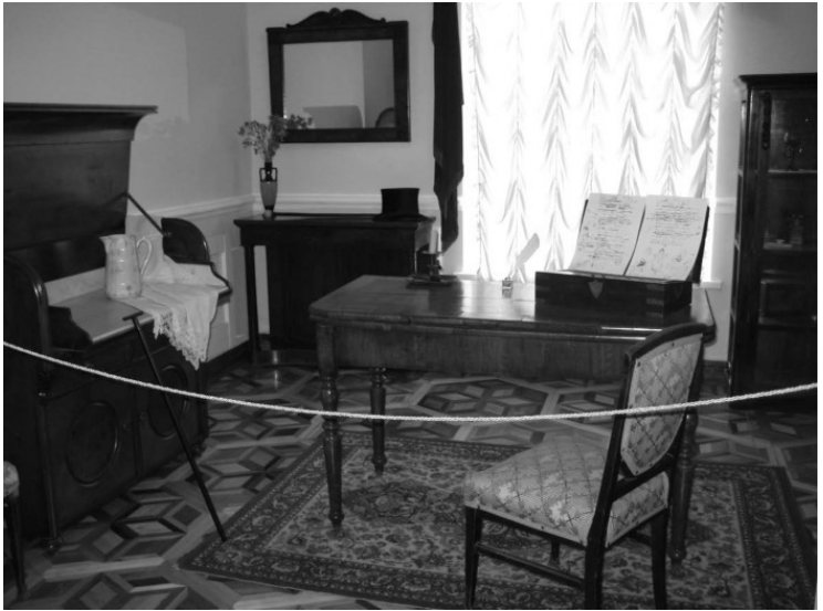
Комната Пушкина в Одесском музее Пушкина

дышают после работы, и все это с неподдельным одесским юмором. Ясно, что великий поэт впитывал южный морской аромат, как губка.