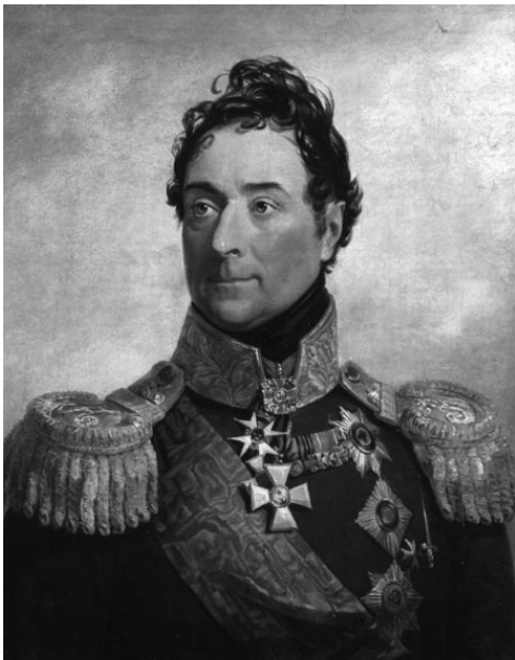
Граф Александр Федорович Ланжерон. Портрет Д. Доу 1825 г

Это Дерибас, Деволан, герцог Ришелье и граф Ланжерон. О чем думают, что замышляют четыре блестящих дворянина и офицера, когда вот так встречаются вместе? Это Дерибас на самом деле впервые пошутил над рассеянным Ланжероном, когда тот повернулся посмотреть на воду Дуная, желтая она или все-таки голубая. Дерибас произнес ставшее впоследствии знаменитым: «У Вас, сударь, вся спина белая». Деволан и герцог Ришелье зашлись от хохота, глядя на то,